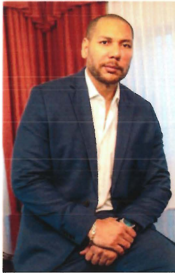
PRESIDENTE AD HONÓREM DEL INDES

Vicepresidente de la Federación Internacional de Baloncesto (FIBA en América). Presidente de la Confederación Centroamericana y del Caribe de Baloncesto (CONCENCABA). Presidente de la Federación Salvadoreña de Baloncesto (FESABAL). Recientemente declarado por la Alcaldía de San Salvador como Ciudadano Honorable de la ciudad capital de El Salvador. Jugador profesional y seleccionado nacional.