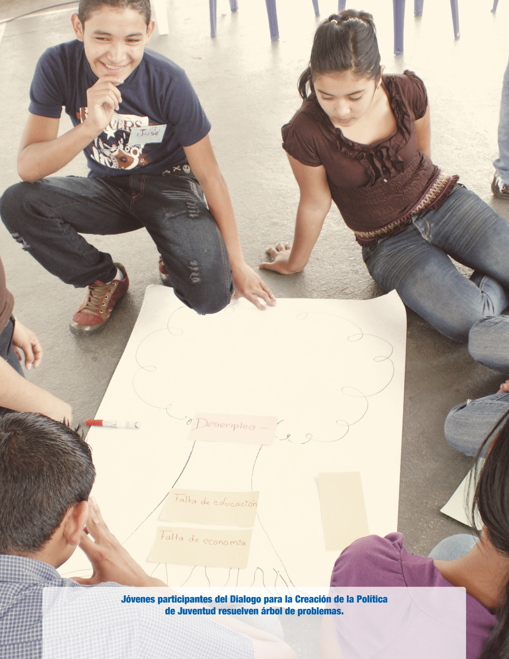
Jóvenes participantes del Dialogo para la Creación de la Política de Juventud resuelven árbol de problemas.