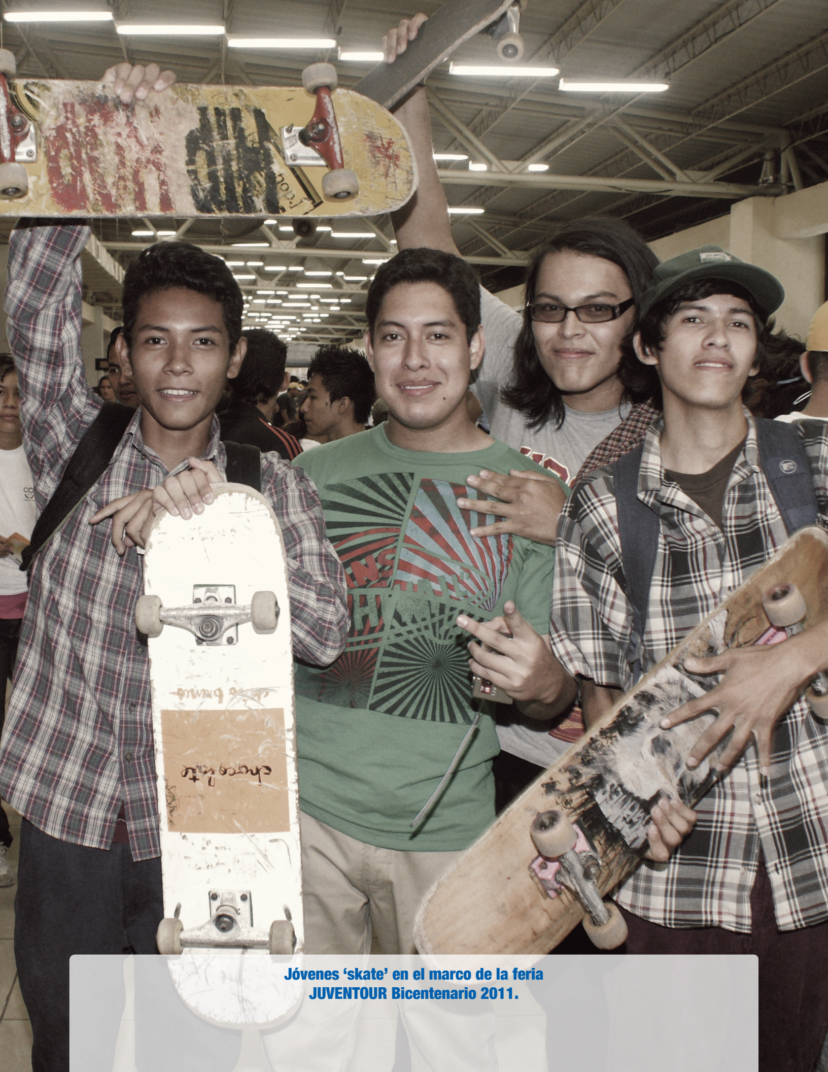
Jóvenes 'skate' en el marco de la feria JUVENTOUR Bicentenario 2011.