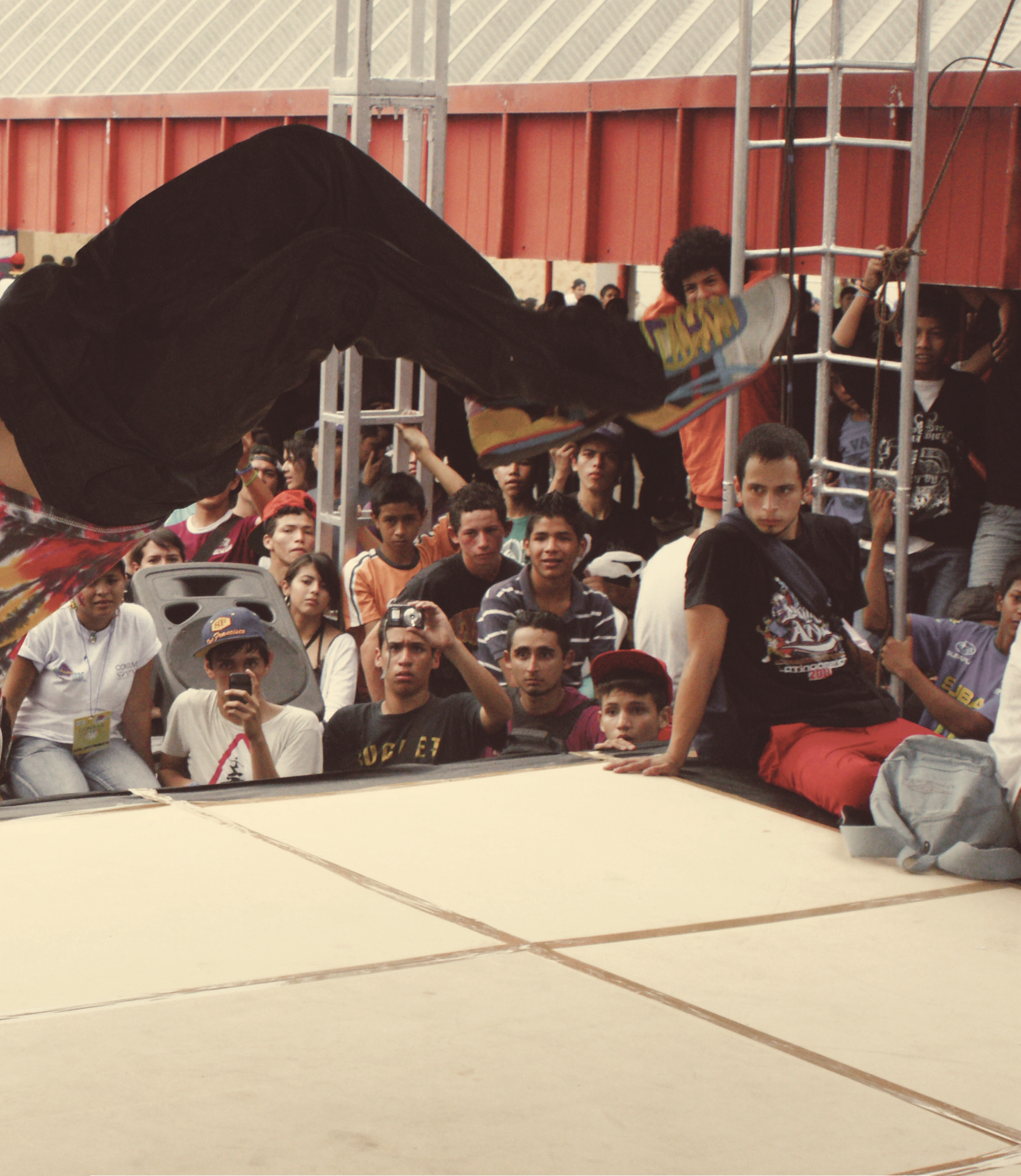
Concurso de 'break dance' realizado en JUVENTOUR Bicentenario 2011