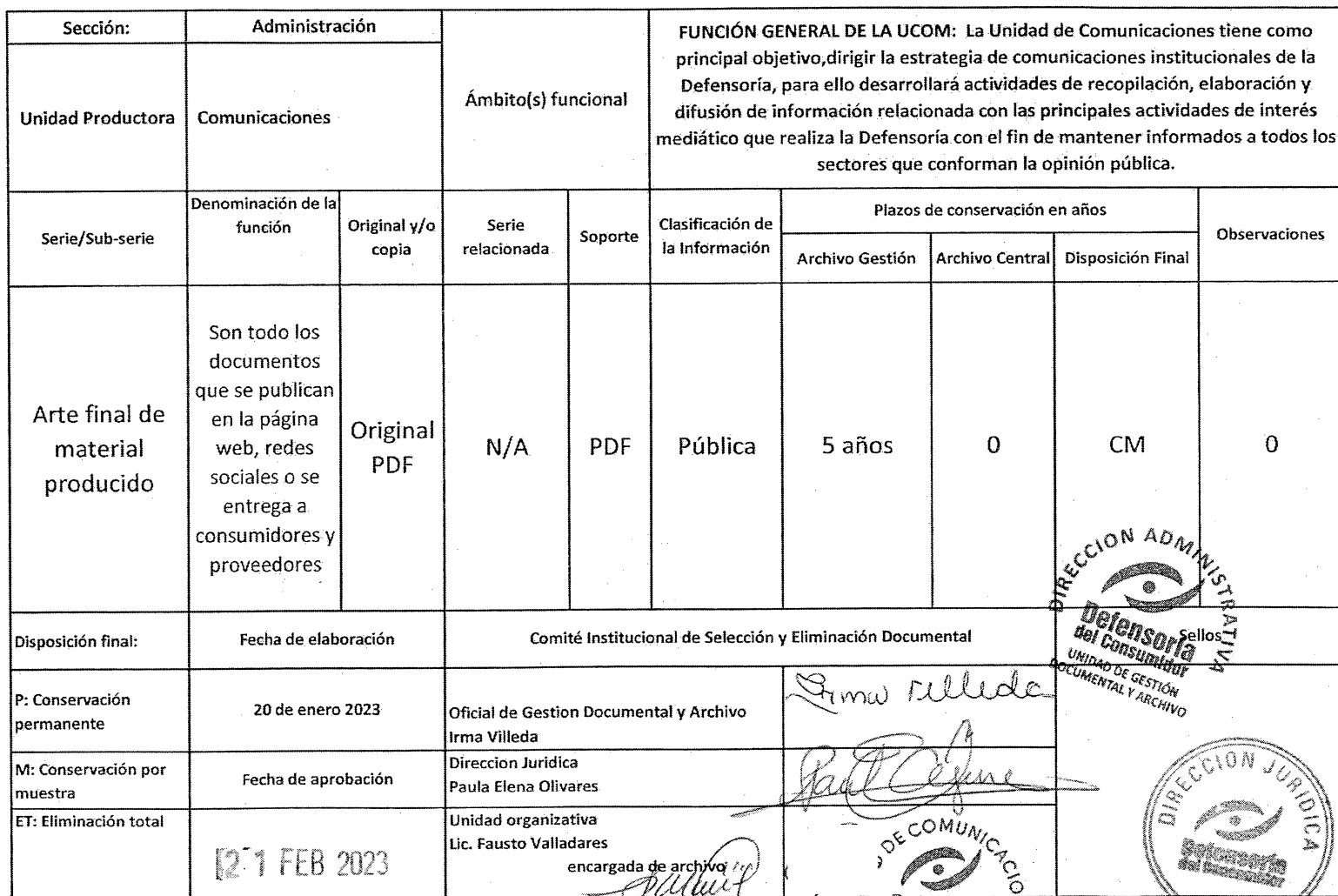
TABLA DE PLAZOS DE CONSERVACIÓN DOCUMENTAL

Sobre el presente documento se elaboró una versión pública, de conformidad con el Art. 30 de la Ley de Acceso a la Información Pública (LAIP), protegiendo los datos personales de empleados públicos que intervinieron en el presente proceso, por ser información confidencial, conforme a lo dispuesto en los artículos 6 letras a, b, f y 24 de la LAIP, así como en la sentencia 21-20-RA-SCA de la Sala de lo Contencioso Administrativo.