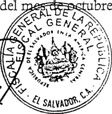
LIC. RODOLFO ANTONIO DELGADO MONTES FISCAL GENERAL DE LA REPÚBLICA