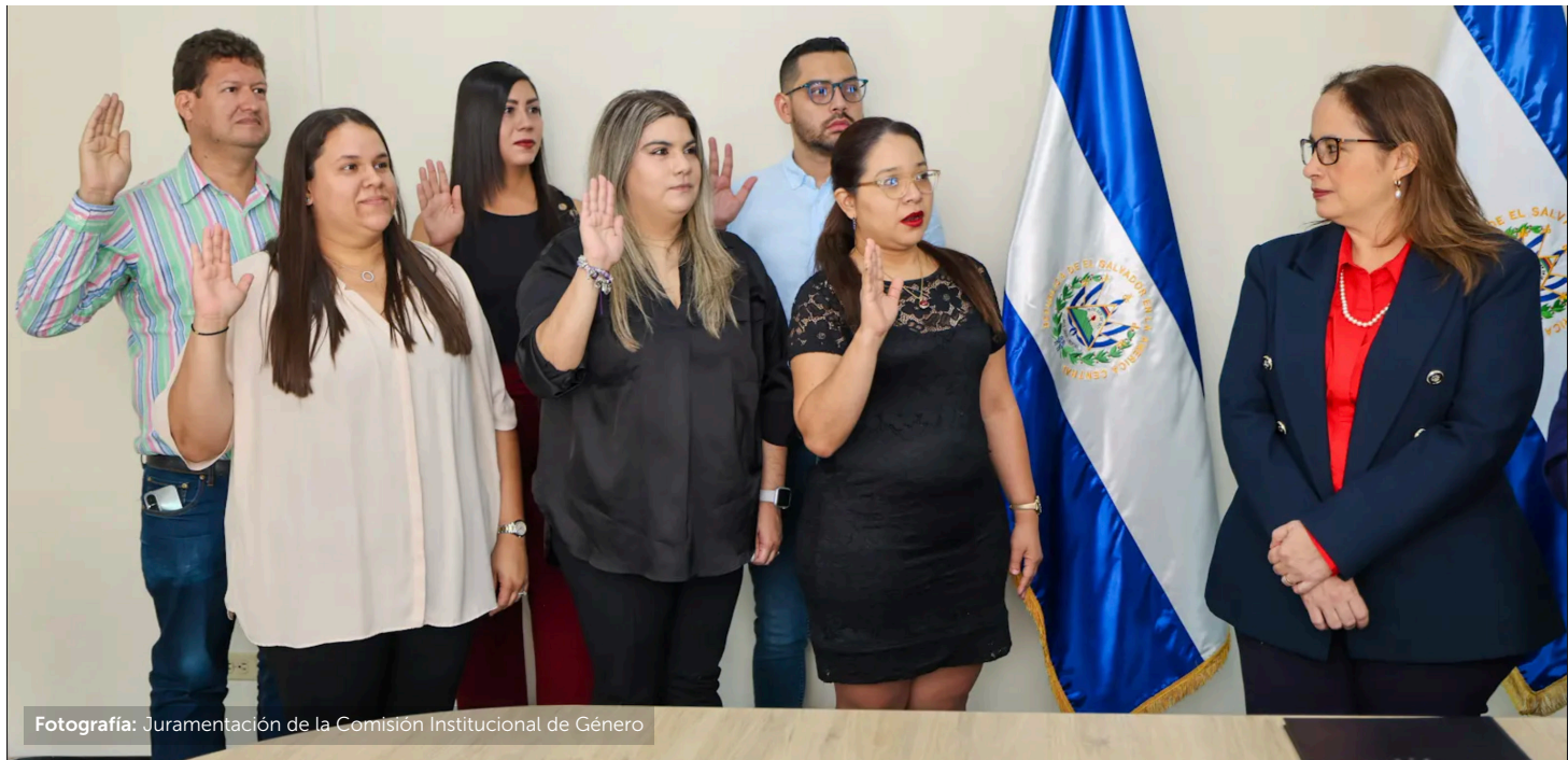
Fotografía: Juramentación de la Comisión Institucional de Género

La Comisión Institucional de Género fue instalada el once de octubre de 2022 a través del acuerdo No. 124/2022. El acuerdo conforma la Comisión por seis instancias: Dirección de Comunicaciones, Dirección Jurídica, Jefatura de la Unidad de Talento Humano, Dirección de Planificación y Política Sectorial, Jefatura de la Unidad de Compras Públicas, Jefatura de la Unidad Financiera y Unidad de Acceso a la Información Pública