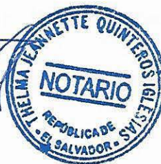
Por "LA CONTRATISTA"