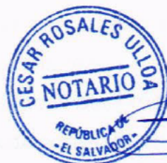
CESAR ROSALES ULLOA Notario.