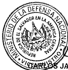
CARLOS JAMME MENA TORRES GENERAL DE AVIACIÓN VICEMINISTRO DE LA DEFENSA NACIONAL