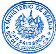
MARÍA ISABEL RODRÍGUEZ VDA. DE SUTTER MINISTRA DE SALUD