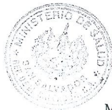
MARIA ISABEL RODRIGUEZ MINISTRA