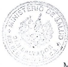
MARIA ISABEL RODRIGUEZ MINISTRA