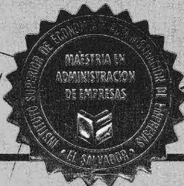
Director de Escuela