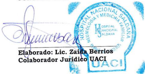
Elaborado: Lic. Zaida Berrios Colaborador Jurídico UACI