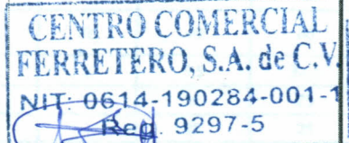
Firma y Sello del Suministrante