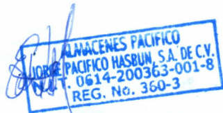
Firma y Sello del Suministrante