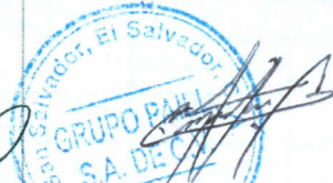
Firma y Sello del Suministrante