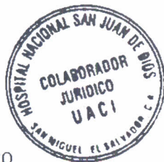
Vo. Bo. COLABORADOR JURÍDICO