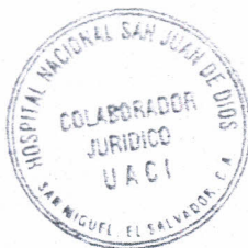
Vo. Bo. COLABORADOR JURÍDICO