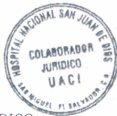
Vo. Bo. COLABORADOR JURÍDICO