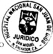
Vo. Bo. COLABORADOR JURÍDICO