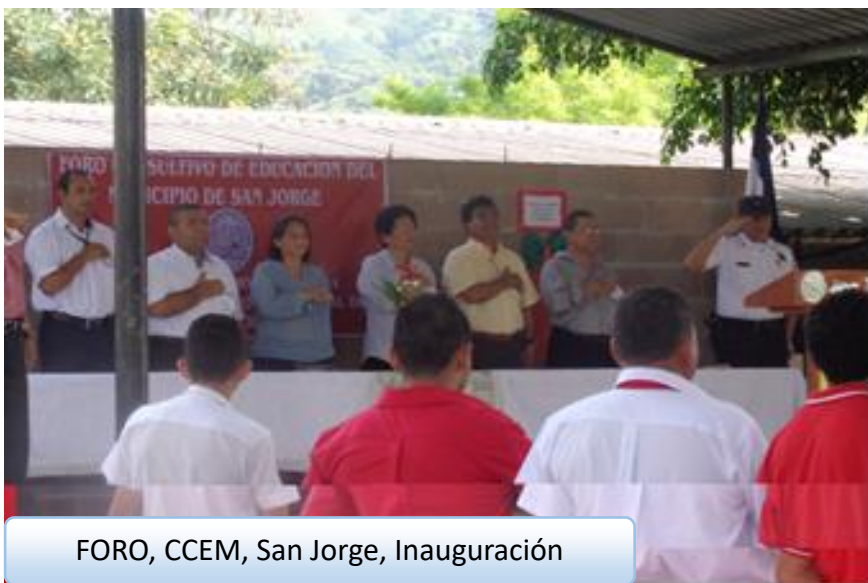
FORO, CCEM, San Jorge, Inauguración