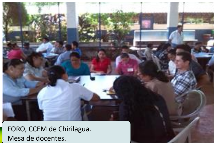
FORO, CCEM de Chirilagua. Mesa de docentes.