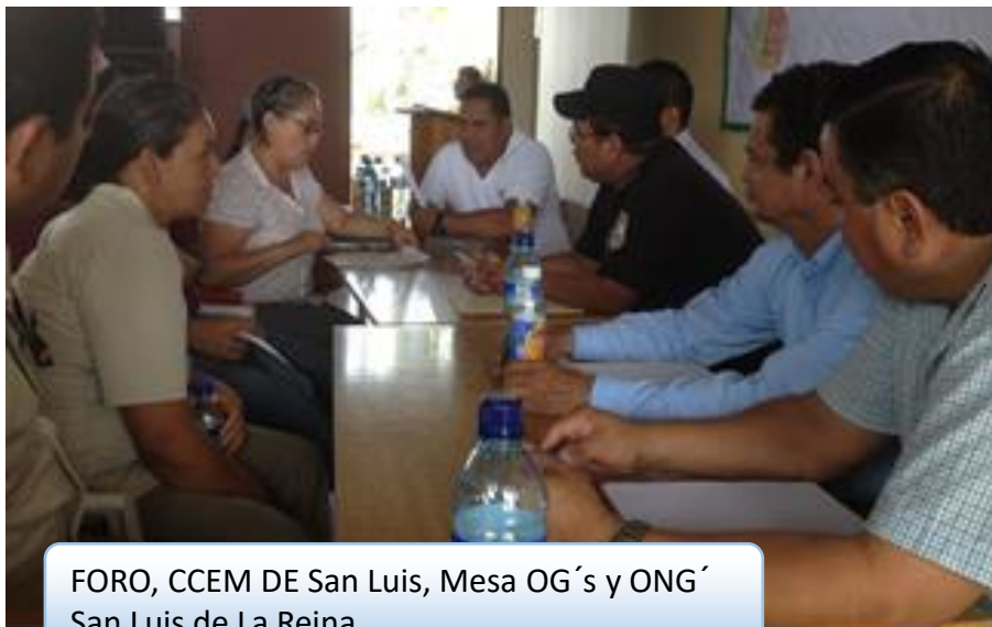
FORO, CCEM DE San Luis, Mesa OG´s y ONG´ San Luis de La Reina