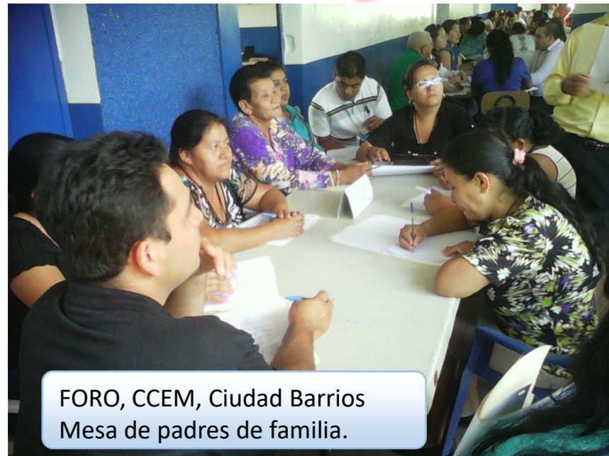
FORO, CCEM, Ciudad Barrios Mesa de padres de familia.