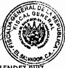
DOUGLAS ARQUIMDES MELENDEZ RUIZ FISCAL GENERAL DE LA REPUBLICA