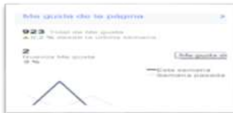
Indicador de expresión a nuestra fan page

Dentro de los resultados alcanzados desde la incorporación a esta red social en el mes de junio del año 2013 hasta el mes de agosto del 2015, el FONAT ha alcanzado un nivel aceptable y siempre en crecimiento en casi un 30% de nuevos usuarios. La tendencia que se muestra en la siguiente gráfica, indica el grado de aceptación de nuestros usuarios y los incorporados que les gusta (“Like” – “Me Gusta”) nuestra institución y el contenido que allí se publica.