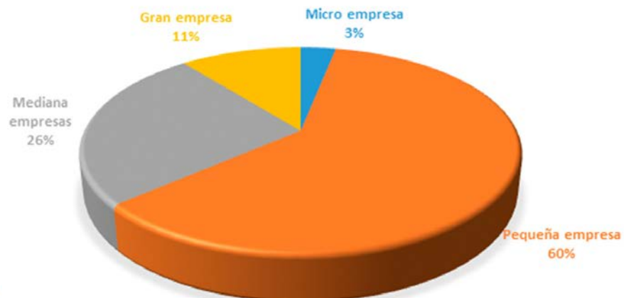
ADQUISICIONES DE OBRAS BIENES Y SERVICIOS MYPIMES