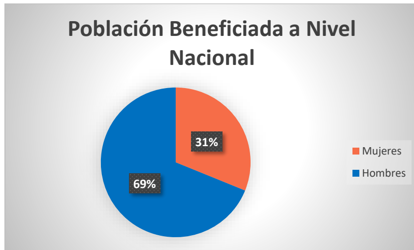
Gráfico 1. Población beneficiada a nivel nacional.

A continuación, se muestran en una gráfica circular los porcentajes de población beneficiada segmentada por género: