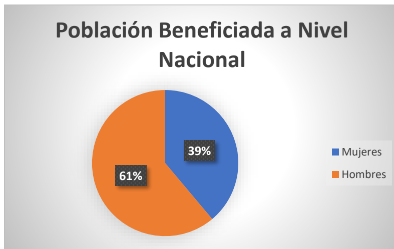
Gráfico 1. Total, de personas beneficiadas segmentadas por género y porcentajes según atención.

En el período de enero a julio del año 2023 se han atendido ochenta y ocho denuncias de forma directa beneficiando a un total de 684 habitantes segmentados en 266 mujeres y 418 hombres a nivel nacional.