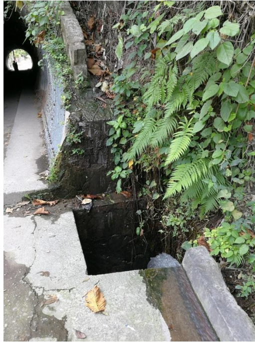
SE PUEDE OBSERVAR LA PRESENCIA CONSTANTE DE FLUJOS DE AGUA EN LA PARTE POSTERIOR DE LA ESTRUCTURA