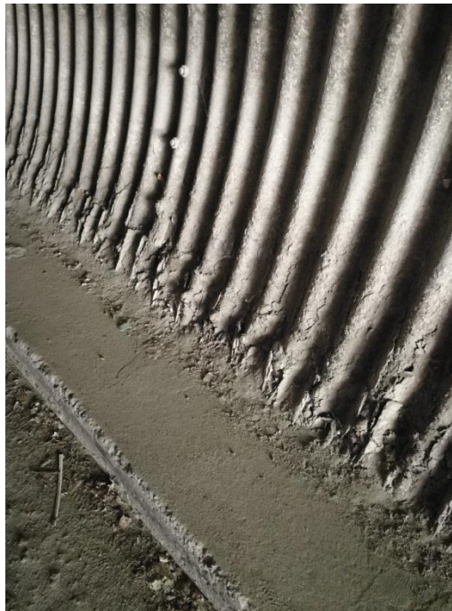
DAÑOS POR CORROSIÓN