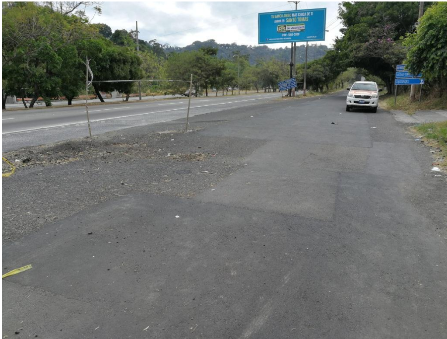
KM 17.8 DE LA RUTA RN055 B: DV. RN065 (LOS PLANES) – DV. SANTO TOMAS.