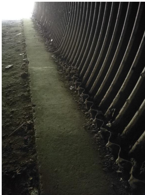
DAÑOS POR CORROSIÓN A LO LARGO DE LA ESTRUCTURA