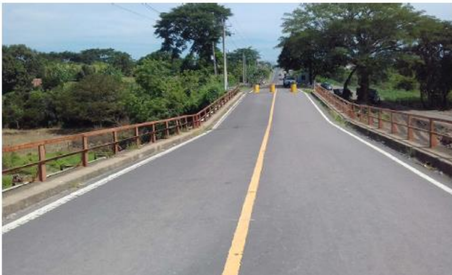
VISTA DE PUENTE COLAPSADO (HACIA SAN SALVADOR)

Las fotografías que se muestran a continuación es un referente de la obra de paso existente. El Contratista está en la obligación de visitar el lugar y verificar las condiciones.