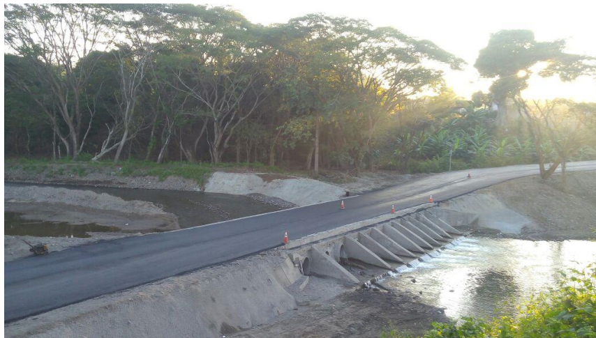
VISTA DEL DESVIO PROVISIONAL