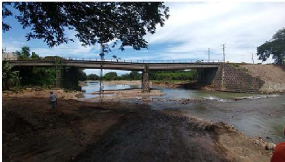
VISTA PUENTE COLAPSADO AGUAS ARRIBA