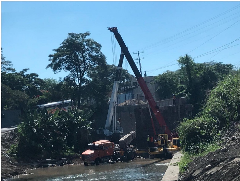
VISTA TRABAJOS DE DEMOLICIÓN