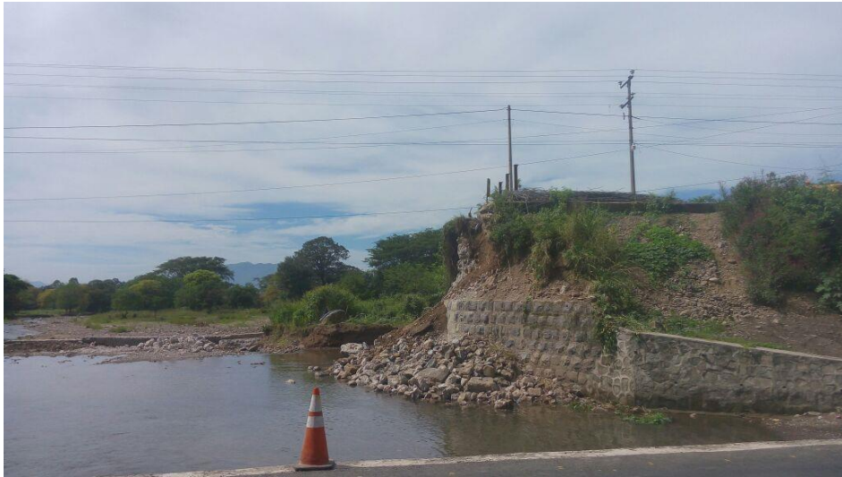
VISTA TRABAJOS DE DEMOLICIÓN DE PUENTE COLAPSADO