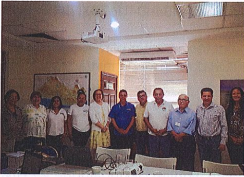
Miembros del comité MAB año 2020 Jiquilisco-Xiriualtique