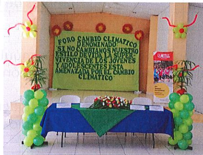
Actividades de jóvenes en