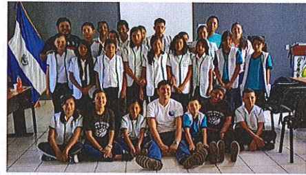
Red de jóvenes de RB