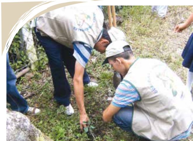
GUARDIANES AMBIENTALES DURANTE REFORESTACIÓN DE CENTRO ESCOLAR