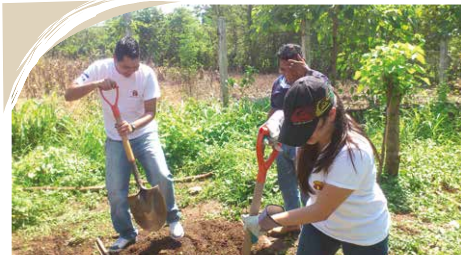
VOLUNTARIOS EN JORNADA DE REFORESTACIÓN EN EL COMPLEJO EDUCATIVO “HACIENDA SANTA CLARA”

El proyecto: “Creación de Red Escolar de Alerta Temprana Ante Desastres” es un esfuerzo conjunto de formar una red de centros escolares con las capacidades de reacción ante desastres naturales y con los recursos básicos necesarios para responder efectivamente ante cualquier eventualidad. Este proyecto fue ejecutado en la cuenca sur oeste del Lago de Coatepeque y engloba 6 centros escolares de los municipios de El Congo y Santa Ana todos de carácter rural. Los centros escolares beneficiados son: Cantón La Laguna, Cantón Vuelta de Oro, Caserío Menéndez Zetino, Fe y Alegría La Merced, Planes de La Laguna y San Juan Las Minas.