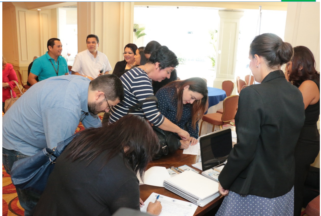
Inscripción de los participantes en el Foro Metropolitano por La Paz y La Prosperidad