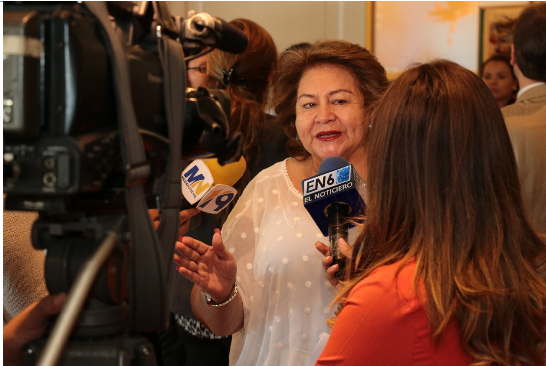
Medios de Comunicación entrevistado a la Alcaldesa Milagro Navas (Antiguo Cuscatlán)