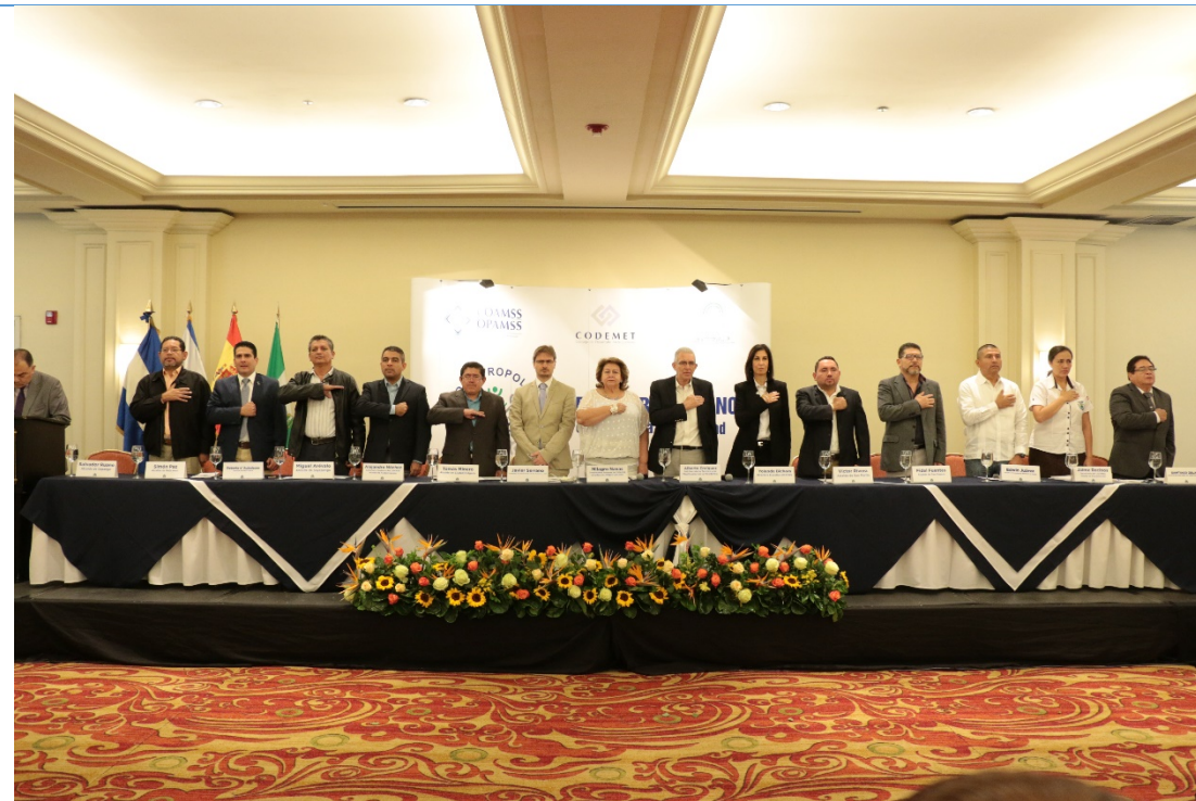
Autoridades que presidieron la Mesa de Honor del Foro Metropolitano por La Paz y La Prosperidad