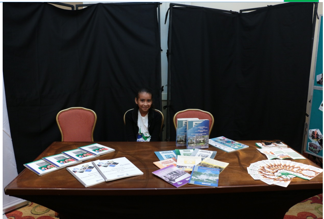
Stands con proyectos e iniciativas impulsadas por el COAMSS-OPAMSS