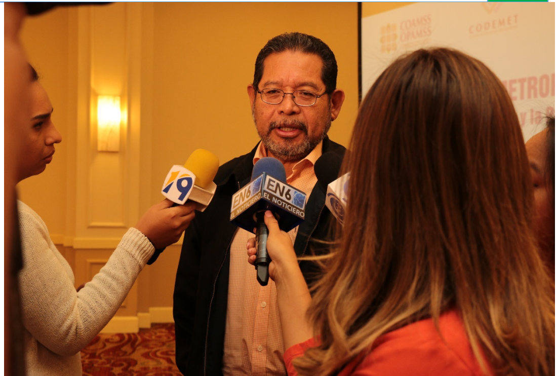
Medios de Comunicación entrevistando al Alcalde Simón Paz (Mejicanos)