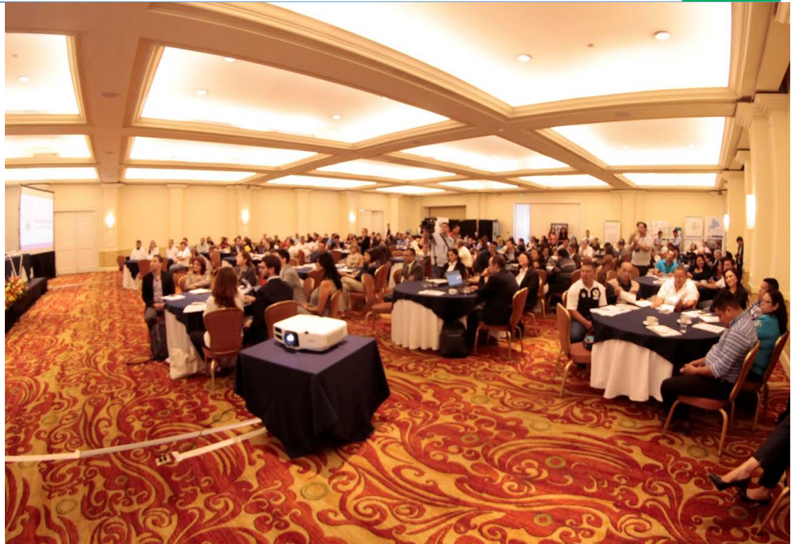
Público asistente al Foro Metropolitano por La Paz y La Prosperidad