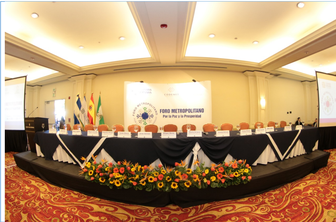
Montaje de la Mesa de Honor del Foro Metropolitano por La Paz y La Prosperidad