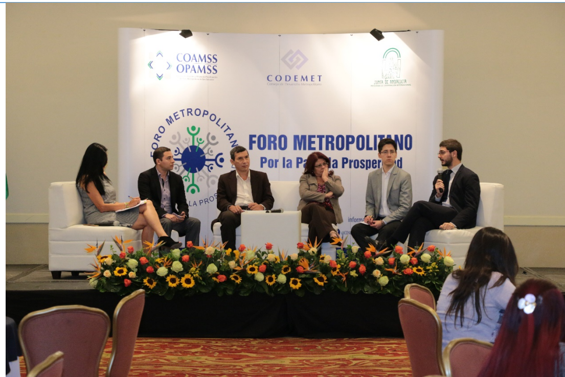
Panel Foro con especialistas que abordaron los Índices de Sustentabilidad Social, Ambiental y Económica