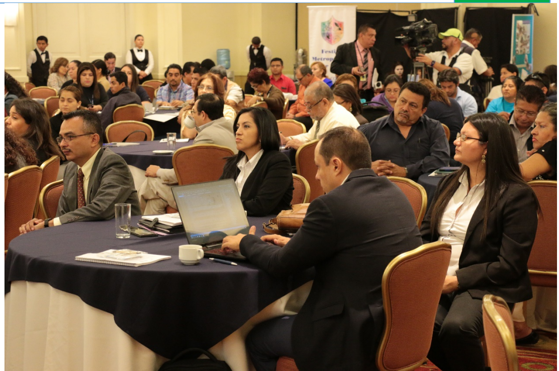
Público asistente al Foro Metropolitano por La Paz y La Prosperidad