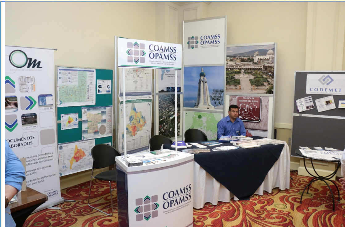
Stands con proyectos e iniciativas impulsadas por el COAMSS-OPAMSS