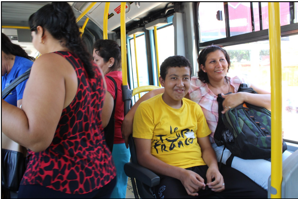
Los rostros de alegría de los padres de familia y sus hijos estudiantes se observaron en el recorrido que se realizó el viernes 21 de agosto de 2015, en el SITRAMSS.

pues la población conoce en la práctica los beneficios que tienen y los que tendrá el sector de personas con discapacidad.