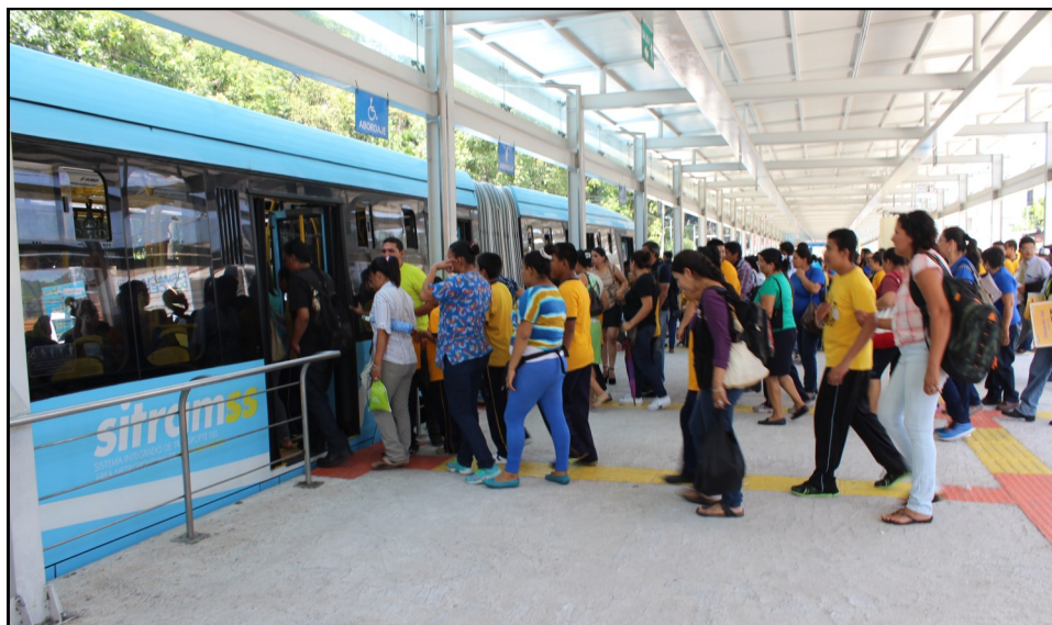
Padres de familia, docentes, personal de SUBES y de I Viceministerio de Transporte facilitaron el recorrido en el SITRAMSS a 97 estudiantes de la Escuela de Educación Especial del Barrio San Jacinto.

El recorrido de las y los estudiantes de la Escuela de Educación Especial del Barrio San Jacinto fue exitoso, pues el objetivo de mostrarles las señales de tránsito y que conocieran el el SITRAMSS se cumplió.