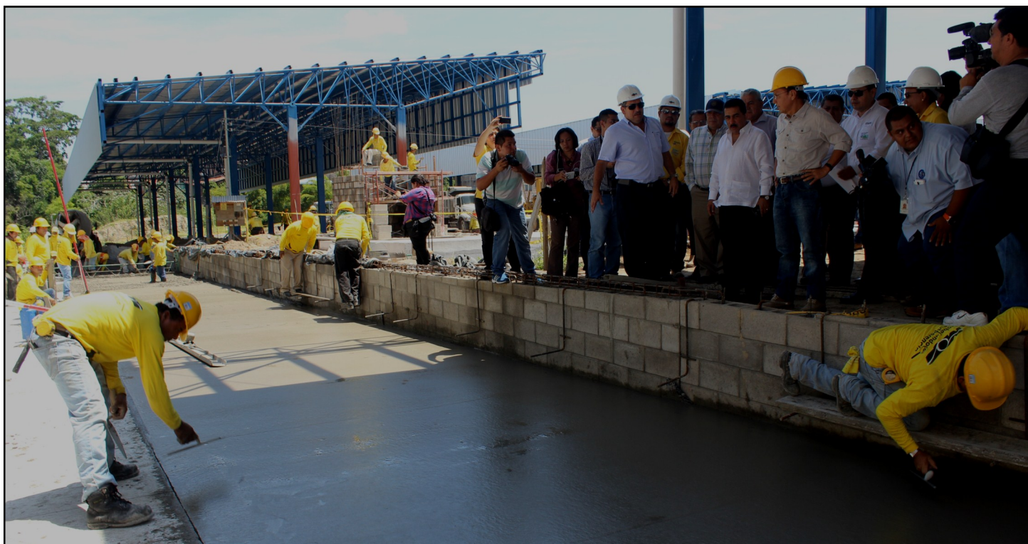
Ministro de Obras Públicas Gerson Martínez y el Viceministro de Transporte Nelson García verificando los avances de la Terminal de Integración del SITRAMSS en Soyapango, este lunes 31 de agosto de 2015.

El Sistema Integrado de Transporte del Área Metropolitana de San Salvador (SITRAMSS) está por finalizar su fase de infraestructura, solo falta culminar con la construcción de la Terminal de Integración de Soyapango, la cual tiene un avance global del 72%, según el Ministro de Obras Públicas Gerson Martínez y el Viceministro de Transporte Nelson García, quienes realizaron una visita a la obra este 31 de agosto.