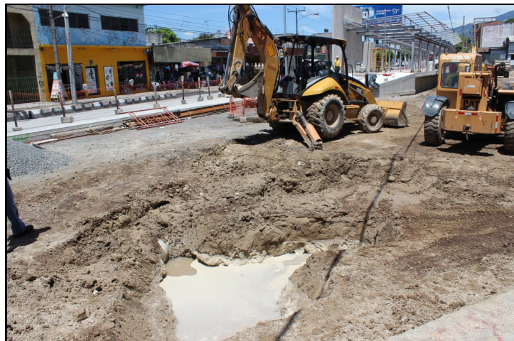
Rotura de tubería de agua potable al costado oriente de donde se construye la estación del Parque Centenario impidió que se siguiera los trabajos por el derrame de agua.

Con ello se estaría dando paso a la construcción de los carriles de concreto hidráulico del SITRAMSS y a los dos carriles de asfalto para el tráfico particular.