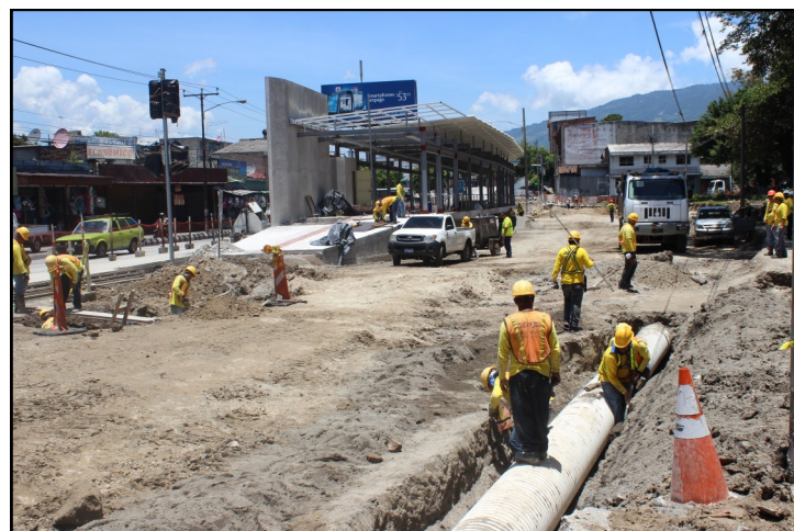
Obreros de ASTALDI trabajan en la instalación de la tubería de agua potable para agilizar los trabajos de construcción pendientes en el costado oriente de la Estación del Parque Centenario.