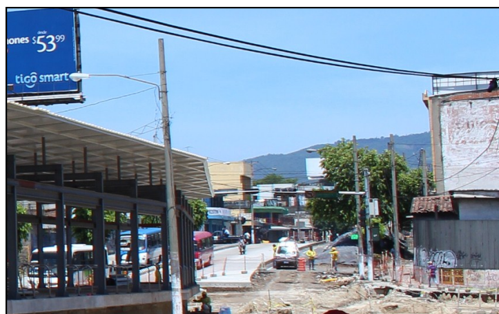
Son dos postes de alumbrado público que CAESS debe mover para que la zona quede libre y así poder continuar los trabajos de construcción en los carriles del SITRAMSS y particulares.