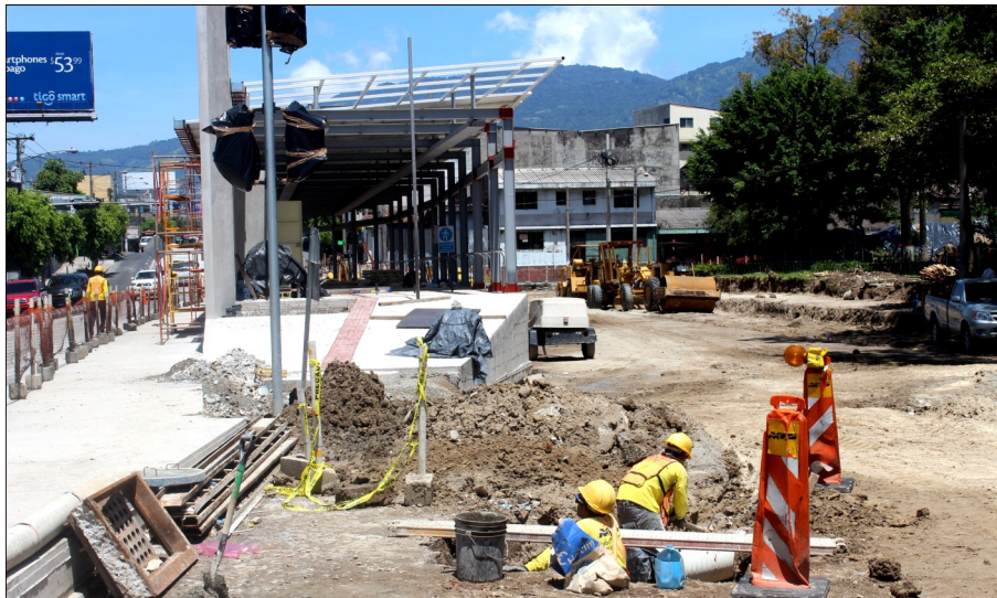
Los trabajos de construcción están centrados en los carriles segregados y particulares de la Estación Parque Centenario y en la instalación de cubierta de techo de la infraestructura.

Se ha instalado las losetas de concreto para la señalización táctil para personas