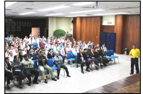
Durante se ejecutaron las obras del SITRAMSS se realizaron asambleas para socializar el proyecto, ésta es una asamblea con empleados del BCR.

En el marco de la Ley de Acceso a la Información Pública, la Unidad Ejecutora ha presentado el proyecto SITRAMSS a diferentes sectores poblacionales, haciendo uso del Artículo 2 de la LAIP: “Toda persona tiene derecho a solicitar y recibir información generada, administrada o en poder de las instituciones públicas y demás entes obligados de manera oportuna y veraz, sin sustentar interés o motivación alguna” .