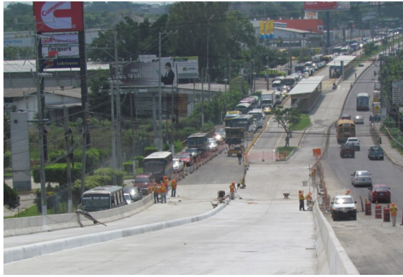
Vista general del corredor segregado del SITRAMSS en el Bulevar del Ejército y al fondo se observa la Estación Amatepec.

Al mes de octubre de 2014 ya se cuenta con la pista de concreto hidráulico de 6.4 kilómetros que lleva en su interior un sistema de tubería de alto impacto con la cual tendrán conexión vía fibra óptica las siete estaciones y la Terminal de Integración, un novedoso sistema con el cual se monitoreará la operación de los autobuses, la frecuencia para hacer más efectivo el servicio y así atender mejor la demanda de pasajeros; además de brindarle seguridad a los usuarios través de video cámaras que están instaladas en las estaciones y la Terminal, así como en los autobuses.