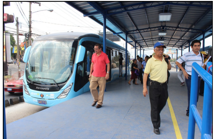
La población ha utilizado el nuevo sistema de transporte y ha comprobado su funcionamiento y los beneficios que las autoridades de transporte anunciaron al inicio del proyecto.

Mientras tanto los empresarios aglutinados en SIPAGO, SÍ99, SUBES y el Viceministerio de Transporte están en un proceso de discusión para llegar a acuerdos para establecer una tarifa accesible que se cobrará cuando entre en vigencia la siguiente fase de operaciones del SITRAMSS.