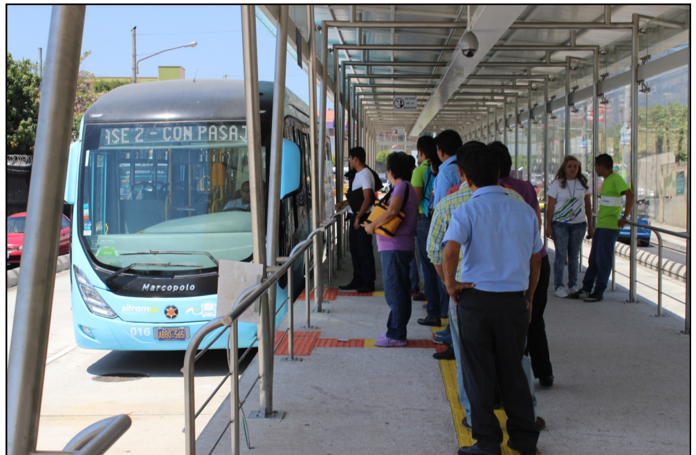
La población sigue usando el SITRAMSS y va en aumento la demanda, así como la emisión de tarjetas para utilizarlos en la fase que está por venir.

Mientras tanto la Fase II continuará movilizandolos gratuitamente a los usua-