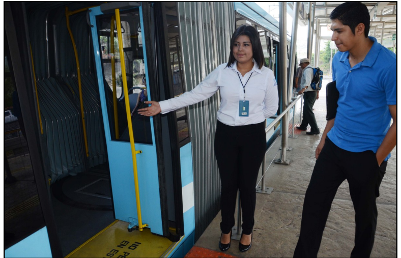
Señorita de Atención a la Ciudadanía orientando a un usuario del transporte público, en la Estación FENADESAL del SITRAMSS.

La calidez es el principio que muestran las señoritas cuan-