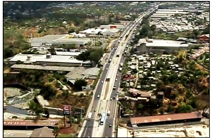
Fotografía aérea de vista hacia en oriente de la troncal o línea 1 Soyapango— Santa Tecla que ha sido intervenida en 6.4 kilómetros.

La readecuación de la red maestra del AMSS llevará varias décadas en desarrollarse para que la población tenga opciones de movilidad y se genere el ordenamiento en la región metropolitana. Si