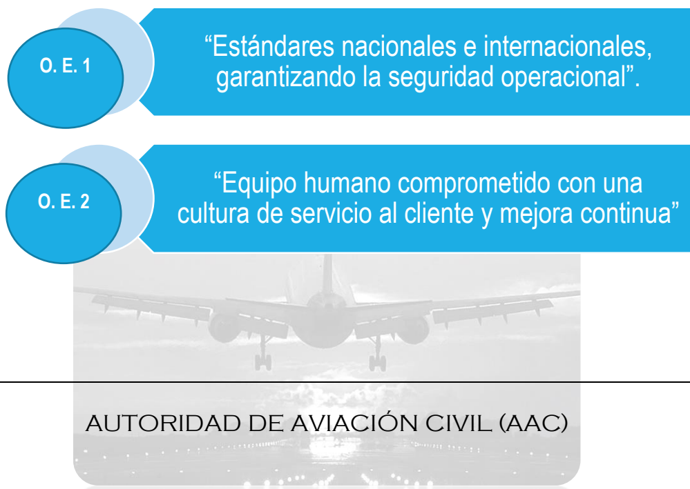
Figura 2. Alineación de los Objetivos Estratégicos con la Misión de la Autoridad de Aviación Civil

La forma en que cada Objetivo Estratégico da cumplimiento a la misión, se describe en la siguiente figura: