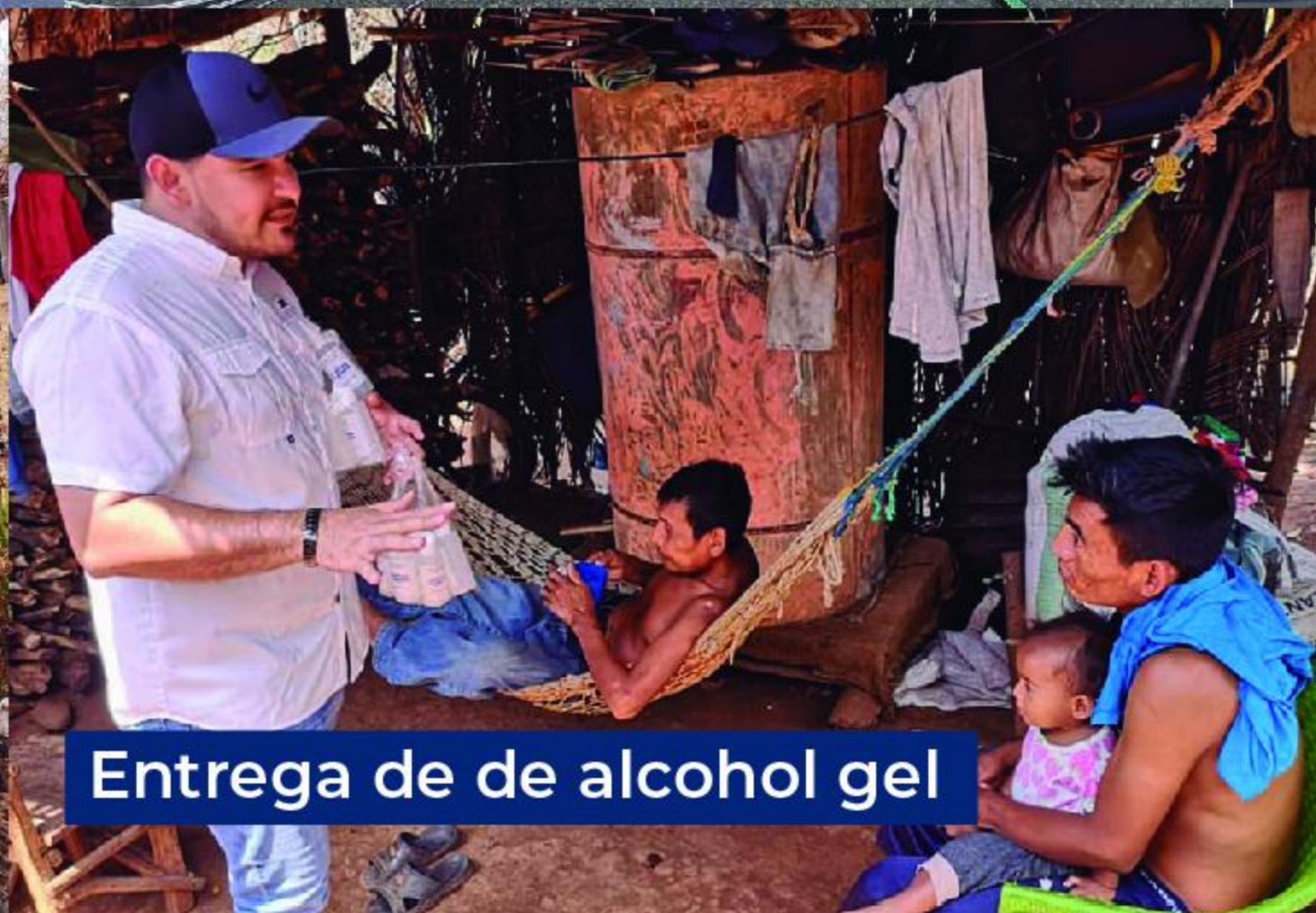
Entrega de de alcohol gel