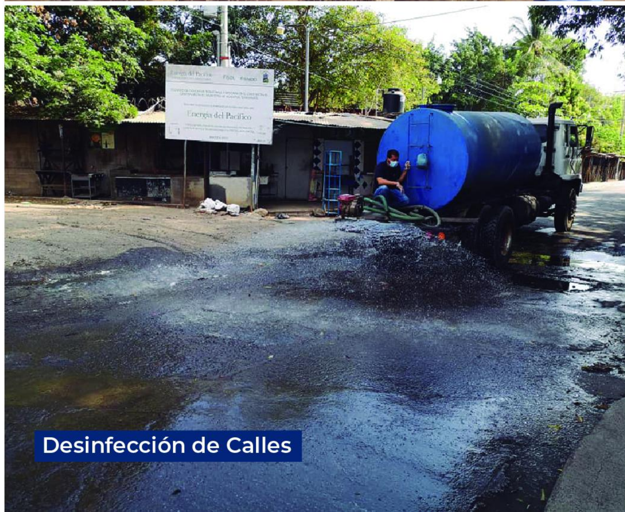
Desinfección de Calles