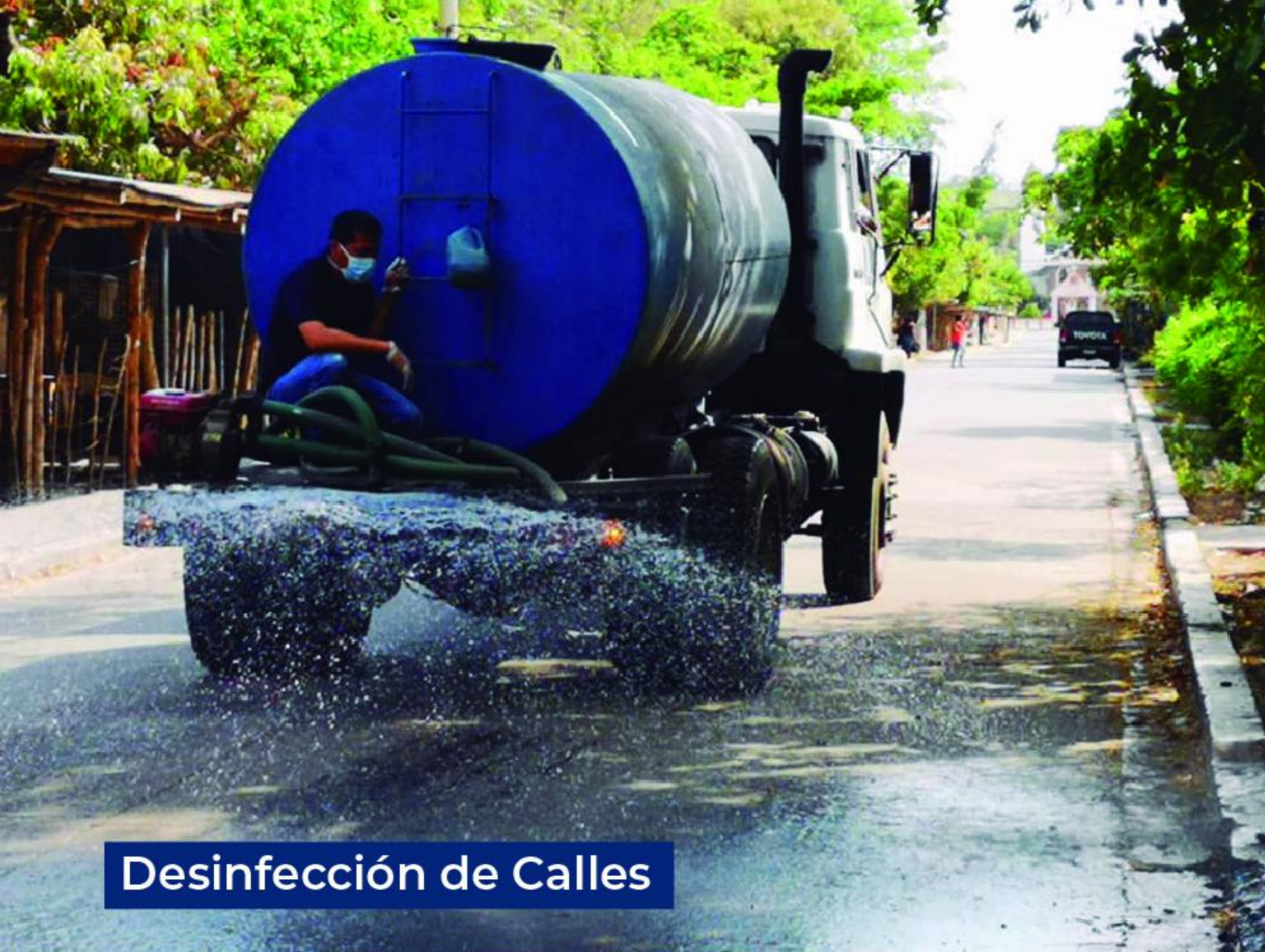
Desinfección de Calles