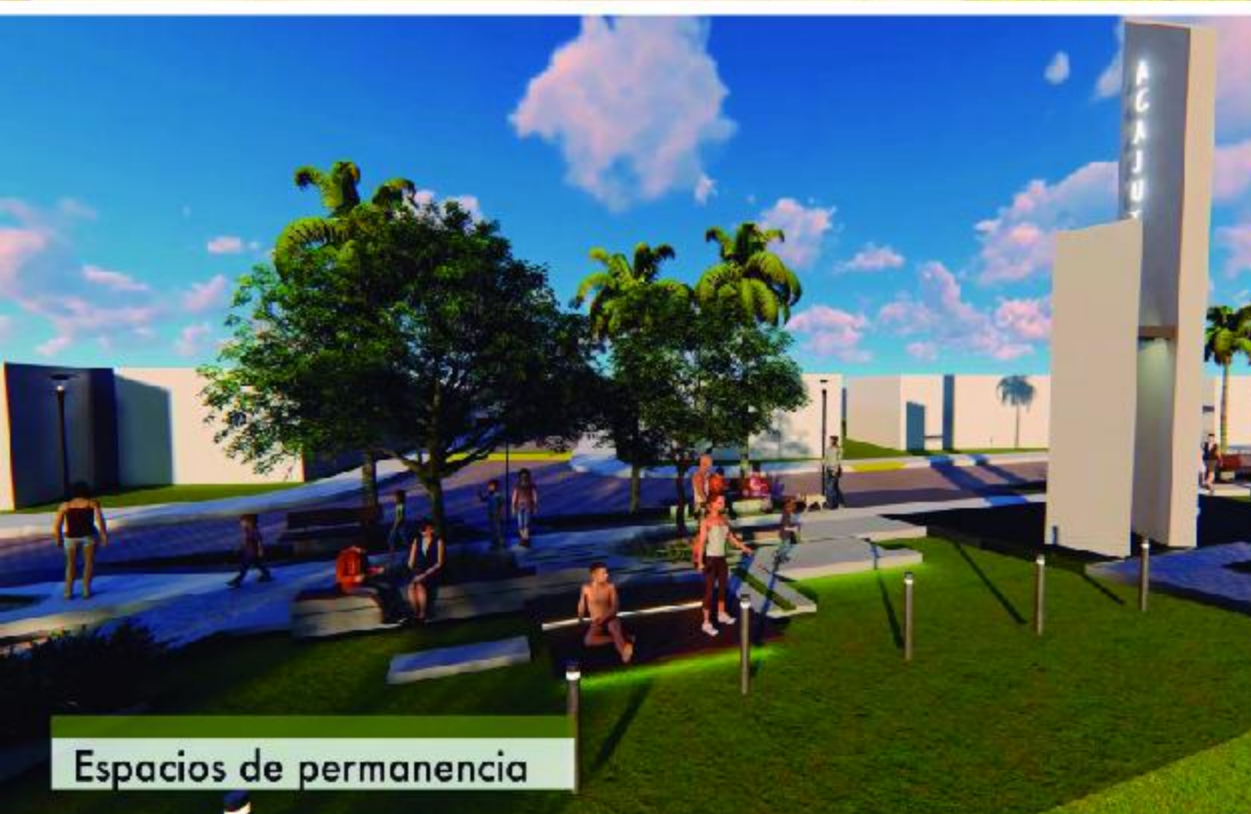
Espacios de permanencia