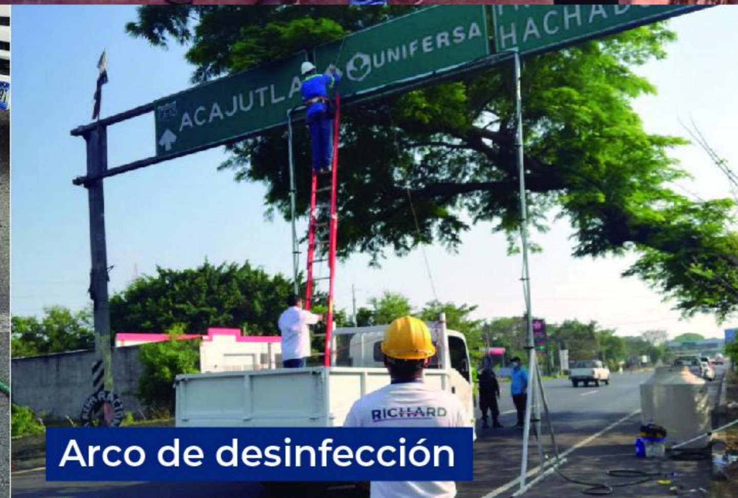
Arco de desinfección