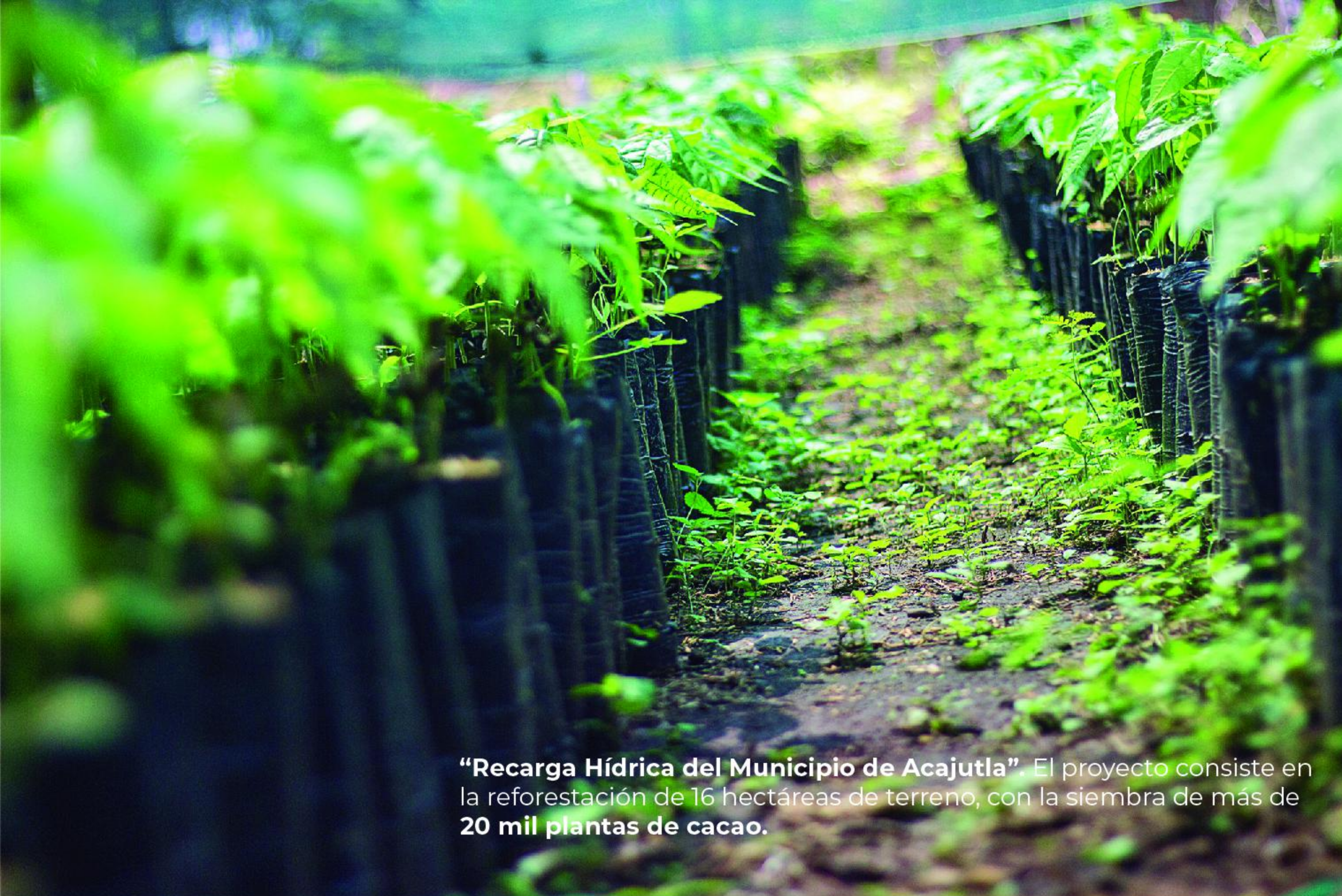
“Recarga Hídrica del Municipio de Acajutla”. El proyecto consiste en la reforestación de 16 hectáreas de terreno, con la siembra de más de 20 mil plantas de cacao.