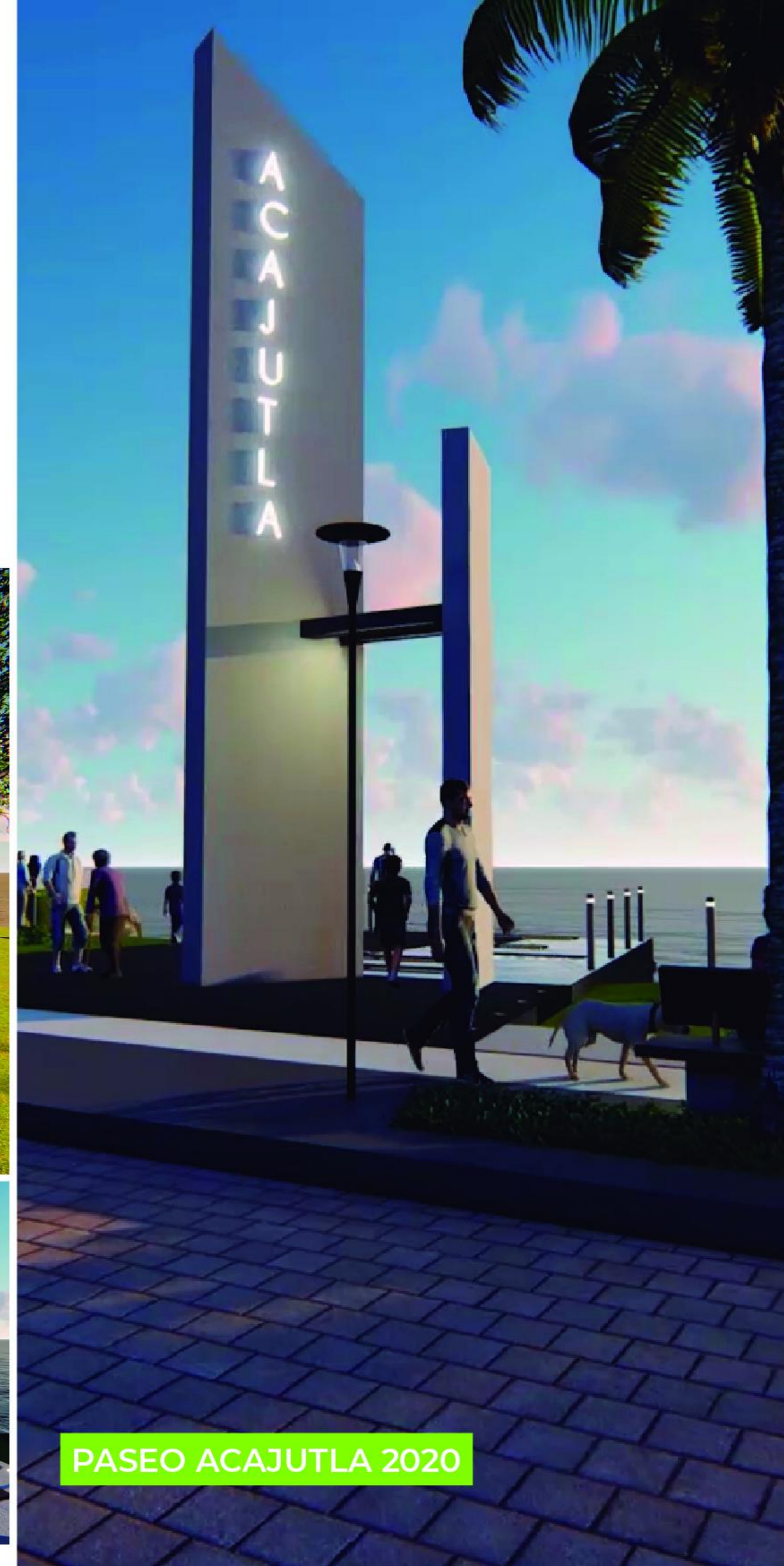
PASEO ACAJUTLA 2020