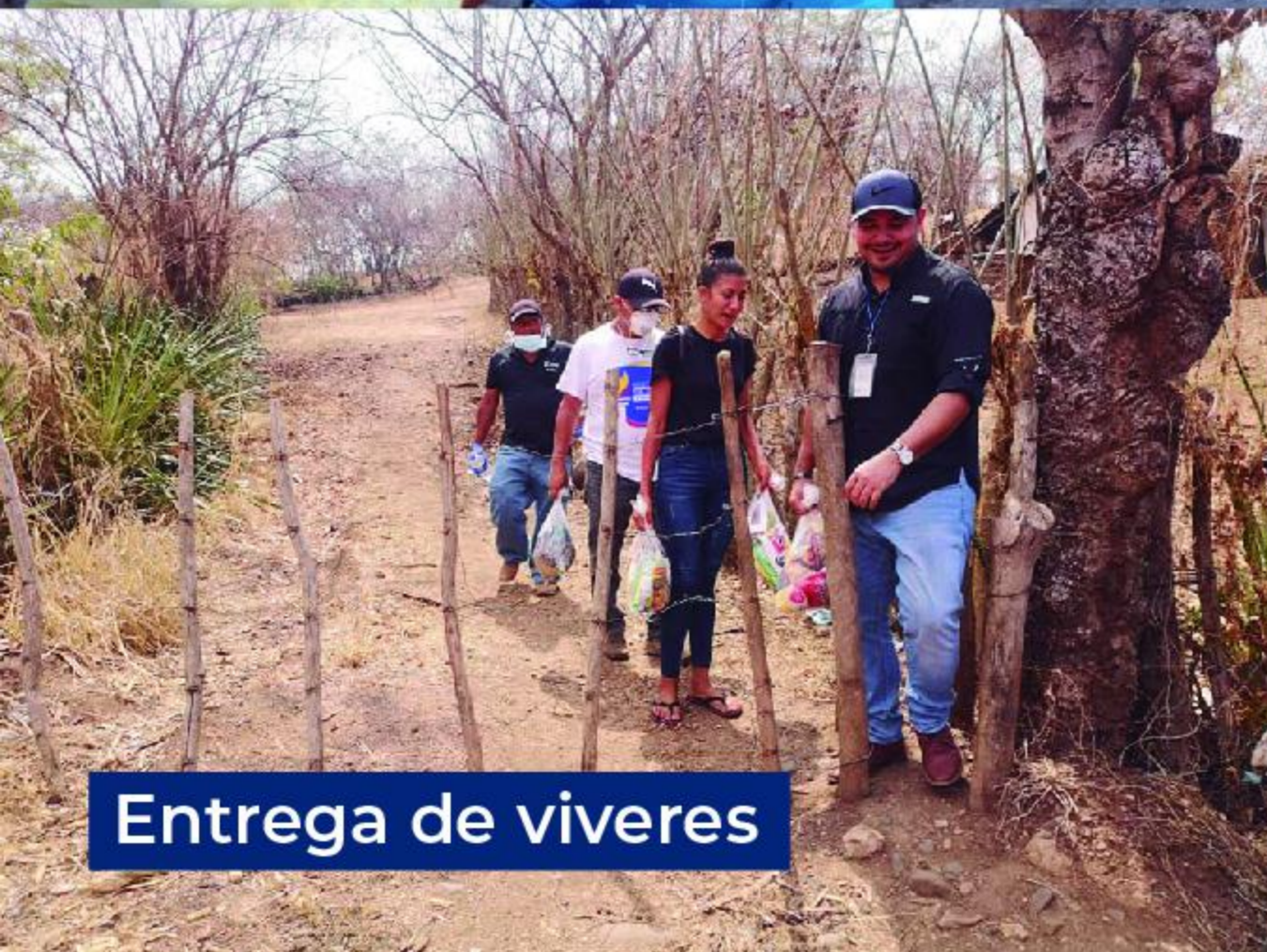
Entrega de viveres