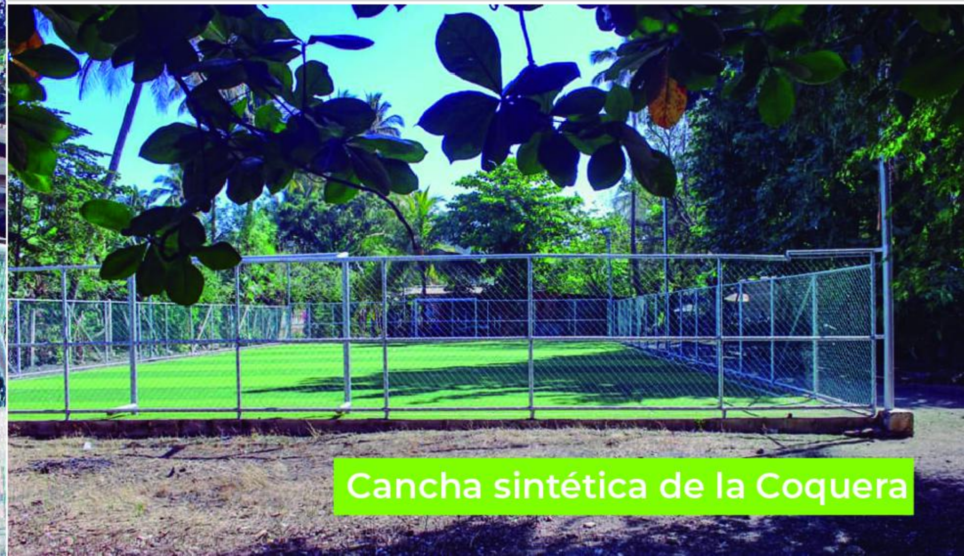
Cancha sintética de la Coquera

adultos y niños se han beneficiado con la restauración de estos espacios deportivos.