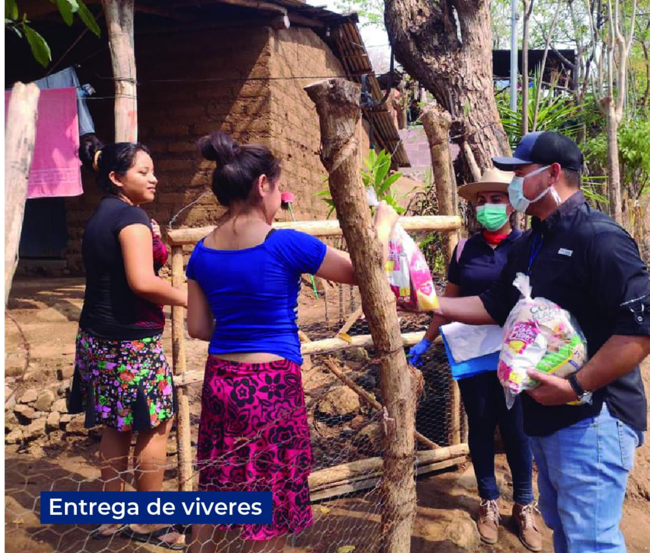
Entrega de viveres