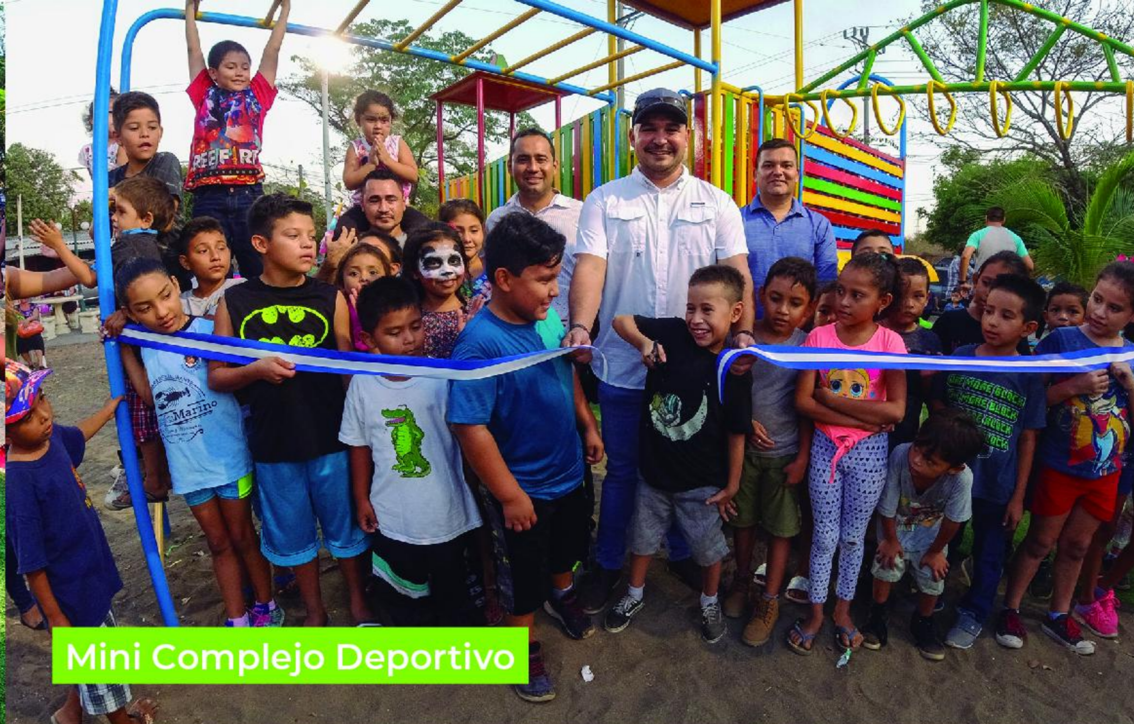
Mini Complejo Deportivo