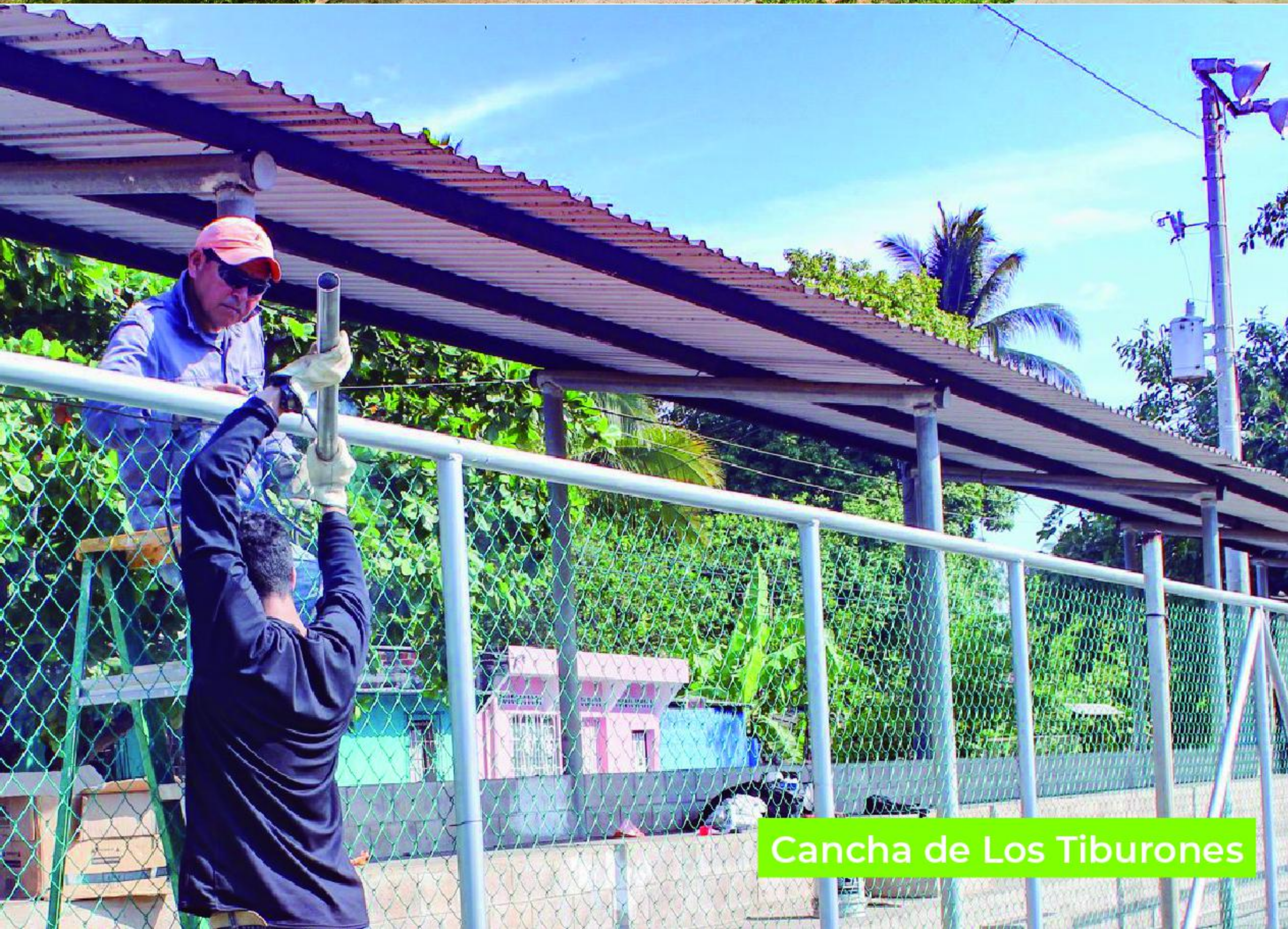
Cancha de Los Tiburones

Además se ha realizado mantenimiento a y reparación de iluminación en las canchas de voleibol y basquetbol, con el objetivo de mantener en buen estado la mayoría de espacios deportivos dentro de nuestro municipio.