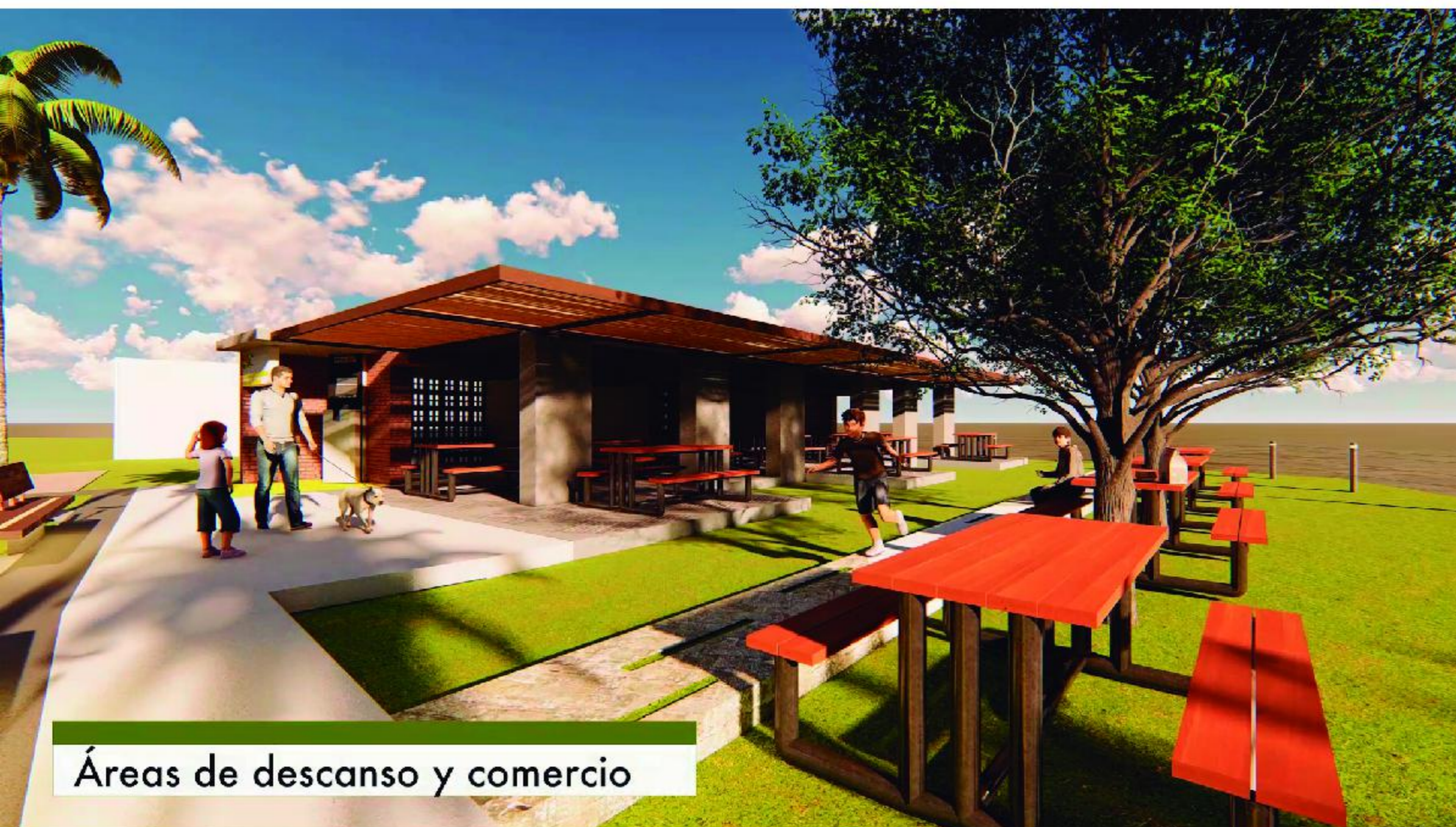
Áreas de descanso y comercio

CONSTRUCCIÓN DE PLAZA TURISTICA ACAJUTLA, BO. LAS PEÑAS, AV. MIRAMAR, MUNICIPIO DE ACAJUTLA , DEPARTAMENTO DE SONSONATE $ 703, 060.50