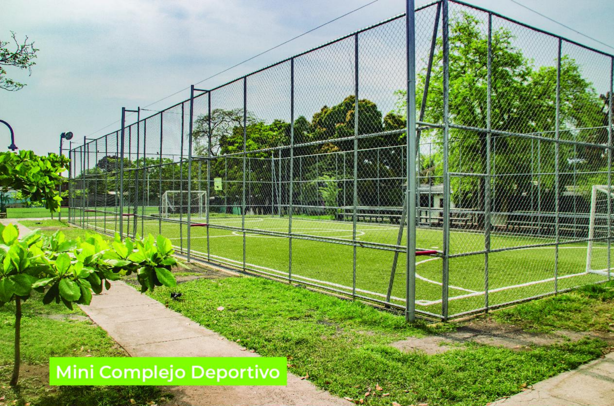
Mini Complejo Deportivo