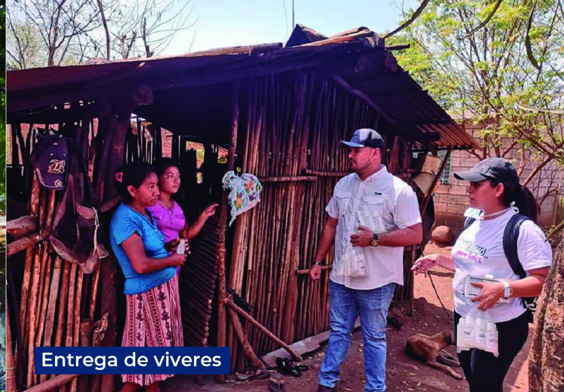
Entrega de viveres