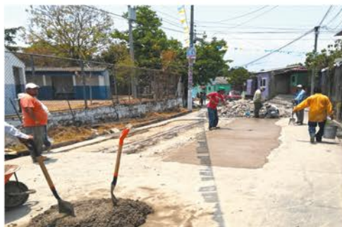
Plan Bacheo 2018