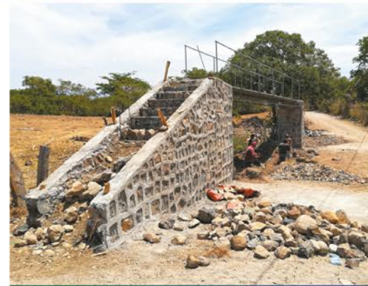
Construcción de pasarelas en Quebrada Seca