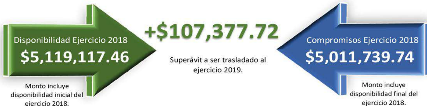
GRÁFICO NO. 4 – COMPARATIVO DE INGRESOS Y COMPROMISOS