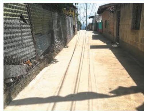
Concreteado y pavimentación en comunidad Caja de Agua