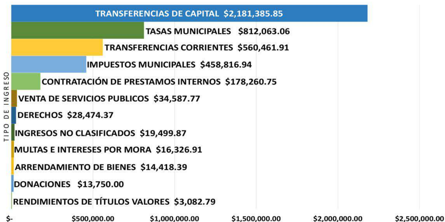
GRÁFICO No. 1 - INGRESOS DEL EJERCICIO 2018.

El gráfico no. 1 detalla los ingresos percibidos para el ejercicio 2018, haciendo un total de $4,321,128.61 ; a este monto se agregó la disponibilidad proveniente de saldos finales del ejercicio 2017, teniendo una disponibilidad total para el ejercicio 2018 de $5,119,117.46 .