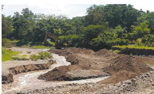
Construcción de bordas en Río Chiquito, Guancora, Cantón Guarjila