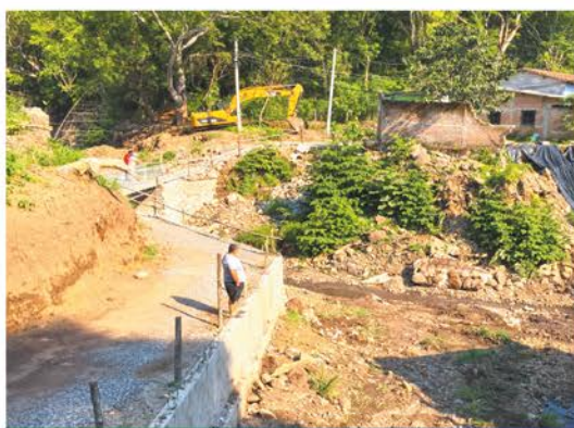
Paso provisional Río Chiquito