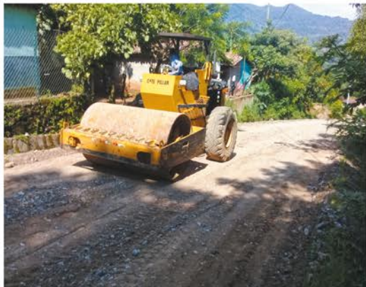
Mantenimiento en calles rurales