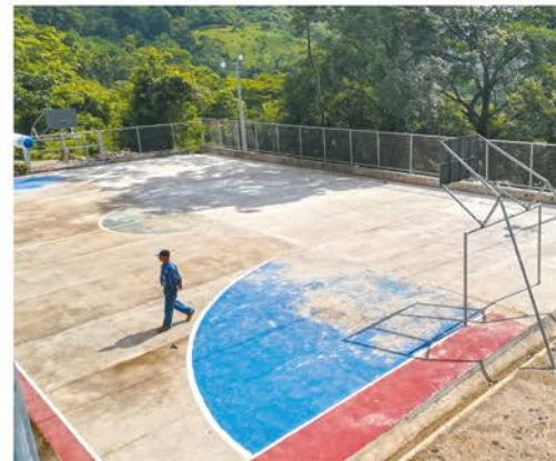
Obras de mitigación en cancha de caserío Los Calles