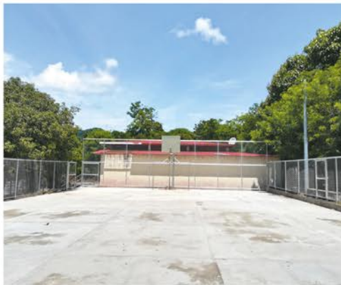
Mejoramiento en cancha multiusos caserío Guancora