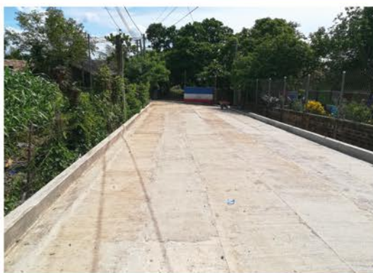
Pavimentación en calle hacia Las Champas, Reubicación 3