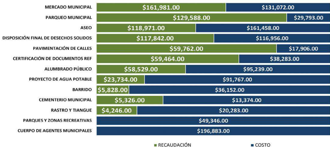
GRÁFICO No. 5 - COSTEO DE SERVICIOS

Inevitablemente, para poder brindar los servicios que la municipalidad prestó durante 2018, se incurrieron en costos. En el Gráfico No. 5, se muestra un panorama de la relación existente entre lo que la municipalidad invierte para satisfacer la demanda de dichos servicios y los ingresos generados por los mismos.