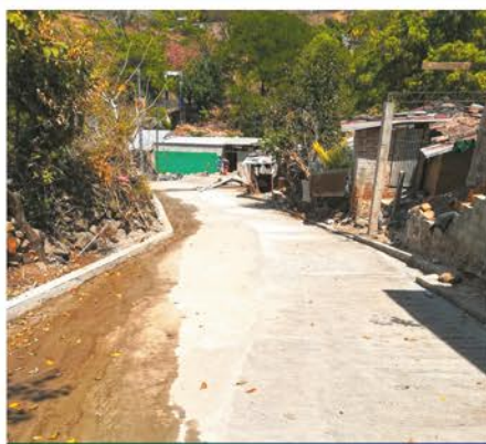
Concreteado de calle en caserío El Aguacatillo