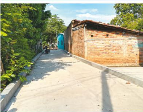
Reparación y construcción de calle en cantón San Bartolo