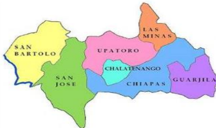
Figura 1: Mapa del Municipio de Chalatenango.

Limita al norte con el municipio de Concepción Quezaltepeque y Las Vueltas, al noreste con San José Las Flores, al sureste con San Isidro Labrador, al sur con San Isidro Labrador, San Antonio Los Ranchos, San Miguel de Mercedes, Azacualpa y San Francisco Lempa; al suroeste con San Francisco Lempa, al oeste por Santa Rita y Suchitoto (Cuscatlán), y al noroeste con Concepción Quezaltepeque.