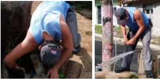
REPARANDO FUGA CHORRO DAÑADO, BARRIO NUEVA ESPAÑA