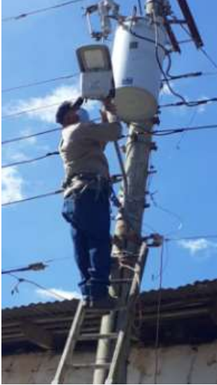
REPARANDO LUMINARIA LED, COSTADO SUR EL GRANJERO