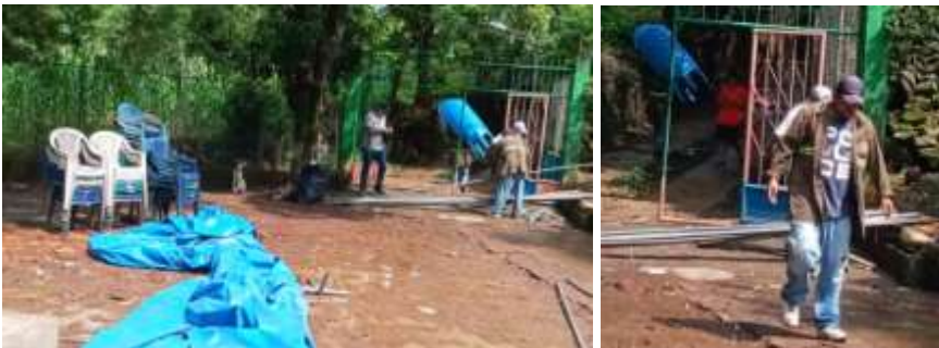
RECUPERANDO SILLAS Y CANOPI, CANTÓN ZARAGOZA