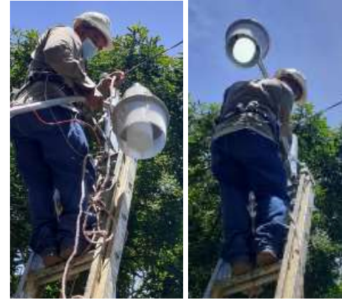
INSTALACIÓN LED NUEVA, MAMEYAL