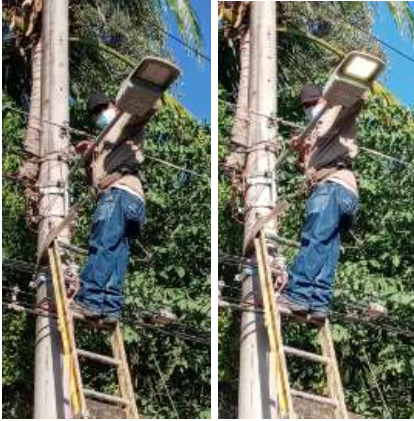
REPARANDO LUMINARIA LED. 3º Y 5º C. PTE., FRENTE A BENEFICIO GUADALUPE