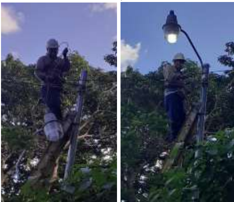
INSTALACIÓN LED NUEVA, OJO DE AGUA