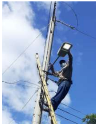
REPARANDO LUMINARIA LED, CANTÓN COPINOL SEGUNDO