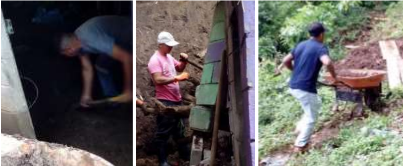
DESALOJANDO MATERIAL POR DERRUMBE, BARRIO YUSIQUE (DÍA 2)