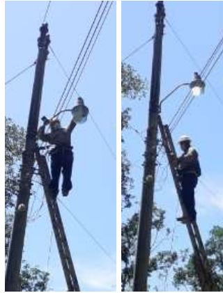
REPARANDO LUMINARIA LED, EL CHOYO