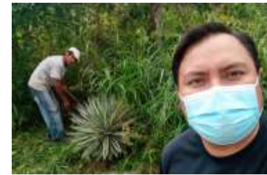
PODANDO ZONA VERDE, BARRIO EL CENTRO