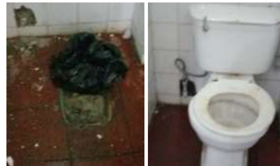
REPARANDO SANITARIO DAÑADO, ESTADIO MUNICIPAL