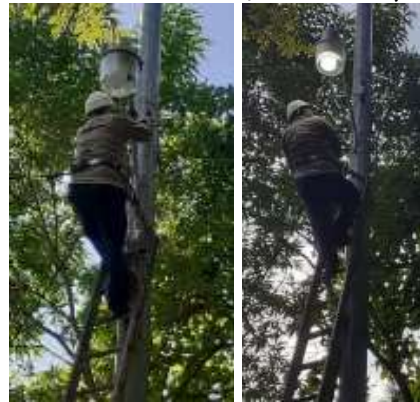
INSTALACIÓN LED NUEVA, OJO DE AGUA (BANCO)