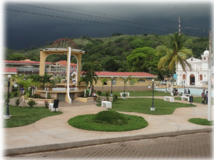
FIGURA N° 1: PARQUE E IGLESIA DE CHIRILAGUA

Por el año de 1770, Chirilagua era una próspera hacienda situada en la parroquia de curato de Conchagua. En 1786 quedó incluida en Partido de San Miguel.