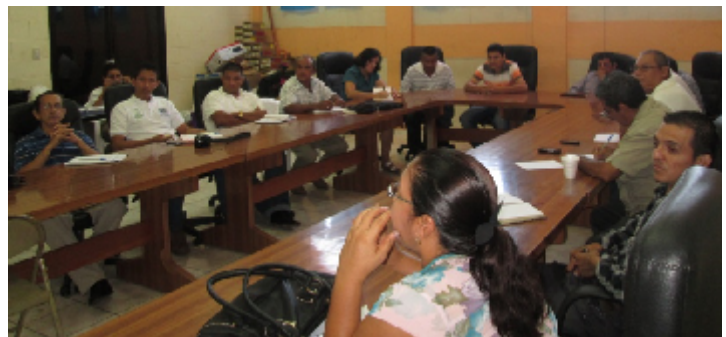
FIGURA N° 9: PARTICIPANTES DE IPP EN TALLER SOBRE GESTIÓN Y ELABORACIÓN DE PROYECTOS

Fortalecer la gestión municipal, logrando mayor eficiencia y eficacia, por medio de la institucionalización e implementación de procesos administrativos modernos, actualización y creación de normativas encaminadas a generar mayor participación ciudadana, sistema de contraloría y toma de decisiones concertadas con la colectividad.