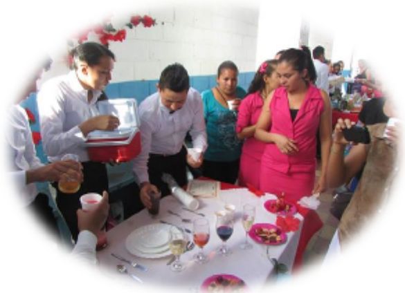
FIGURA N° 7: JÓVENES EN CURSOS DE BAR TENDER

Mejorar la calidad de vida de los habitantes de Chirilagua, por medio de la implementación de procesos cualitativos y sustantivos de cobertura en temas de educación, acceso a las tecnologías de la información y la comunicación, seguridad social, cultural, sano esparcimiento; considerando la familia, sus valores, como eje central de la sociedad.