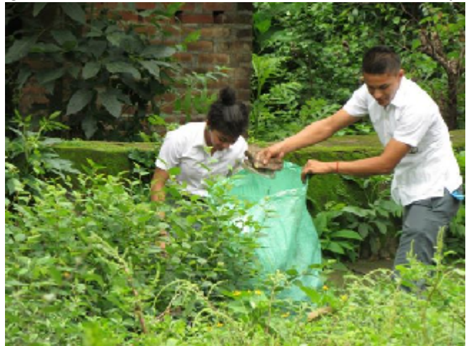
FIGURA N° 8: ESTUDIANTES PARTICIPANDO EN CAMPAÑA DE LIMPIEZA

Implementar un proceso de desarrollo integral, transformando la naturaleza en bienes y servicios de manera sostenible y en armonía con el entorno ambiental, logrando el equilibrio y mejorando las condiciones de los ecosistemas que permiten los modos de vida de las diferentes especies y en particular la especie humana.