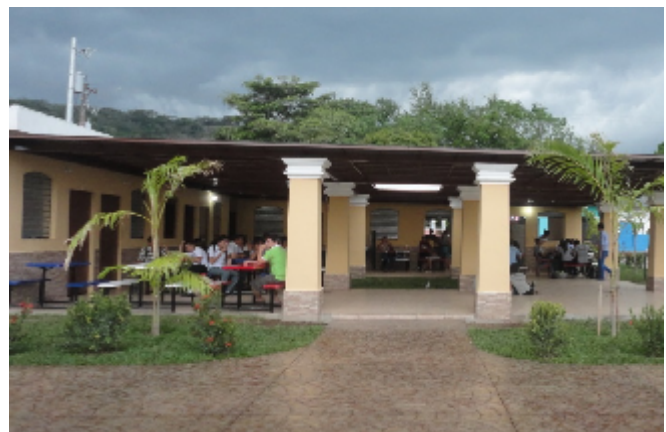
FIGURA N° 10: VENTA DE COMIDA EN PARQUE CENTRAL

Para asignar puntaje a cada uno de los criterios, se utilizarán una serie de indicadores y rangos de ponderación, que permitirán identificar los proyectos que se priorizarán.