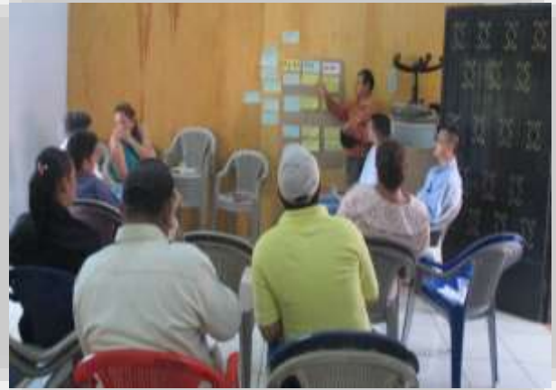
Taller Sectorial Socio - Cultural