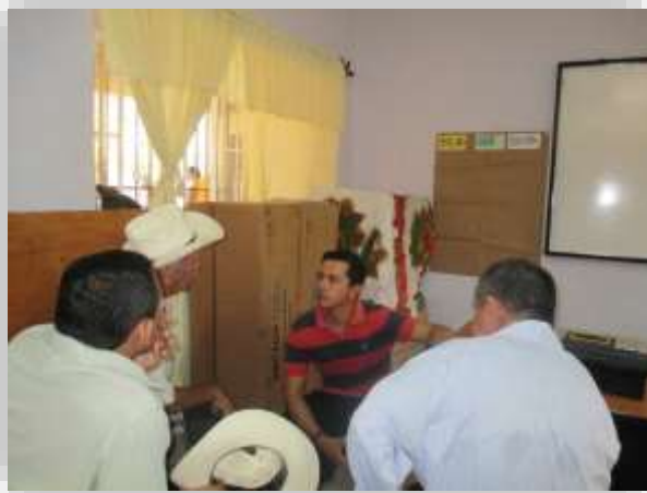
Taller Territorial Zona Urbana