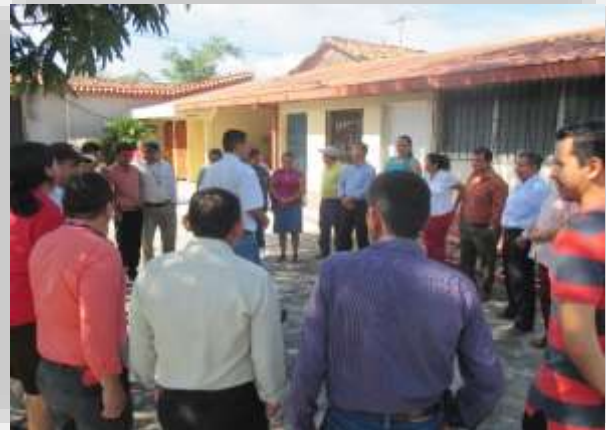
Dinámica de ambientación