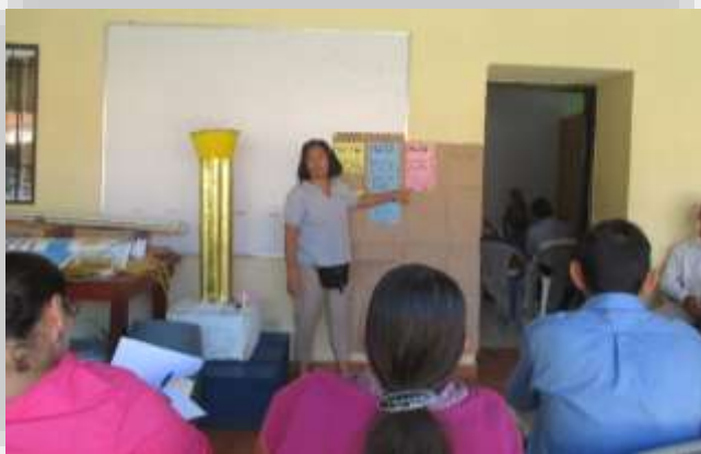
Taller Sectorial Económico y Ambiental / Reducción de Riesgo