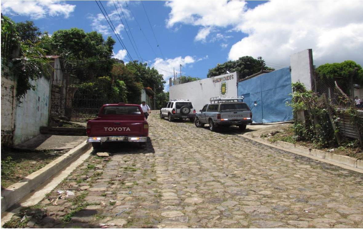
CONCRETEADO EN CALLE ACCESO A CENTRO ESCOLAR DE SAN EMIGDIO, GUADLUPE.