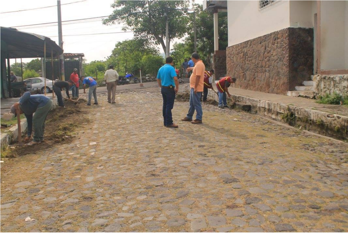
CALLE QUE CONDUCE AL CENTRO ESCOLAR $20,812.59