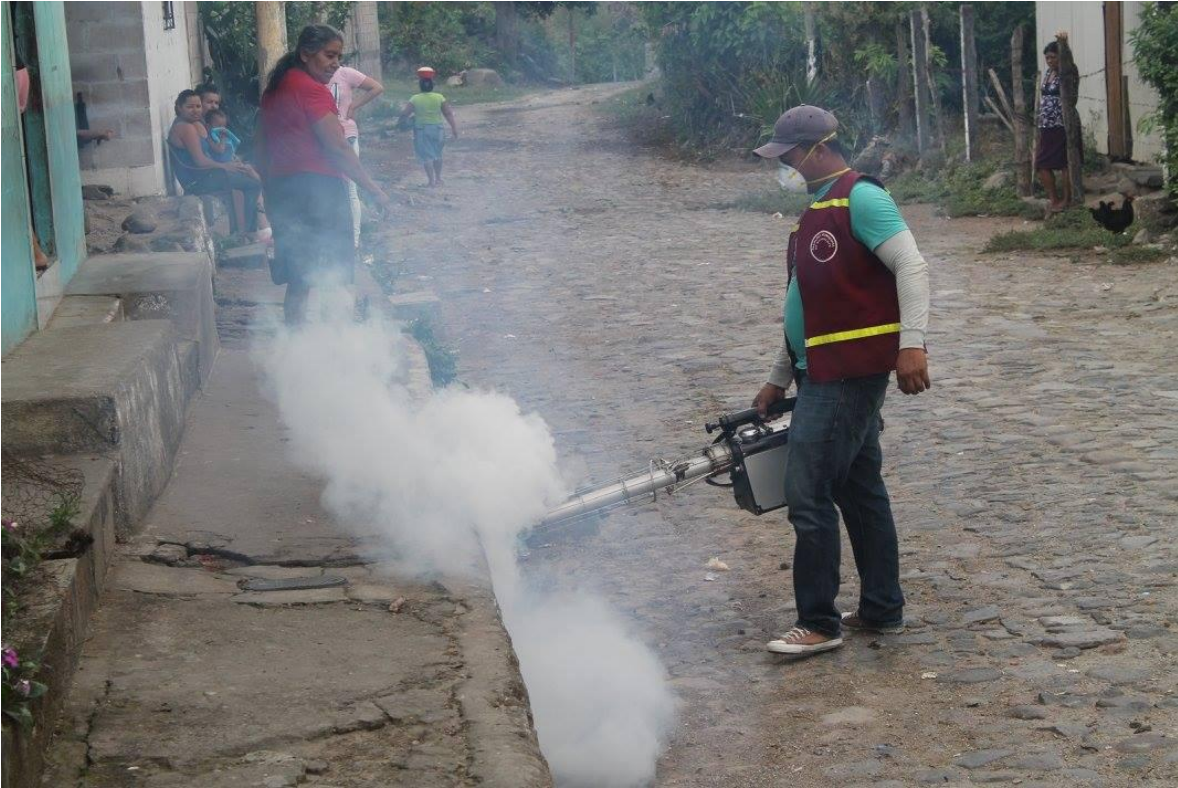
FUMIGACION CONTRA EL ZANCUDO TRANSMISOR DEL DENGUE