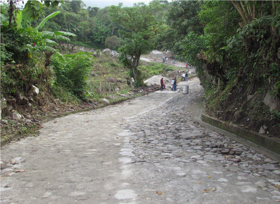
CALLE DE ACCESO AL CEMENTERIO MONTO ASIGNADO $27,847.00