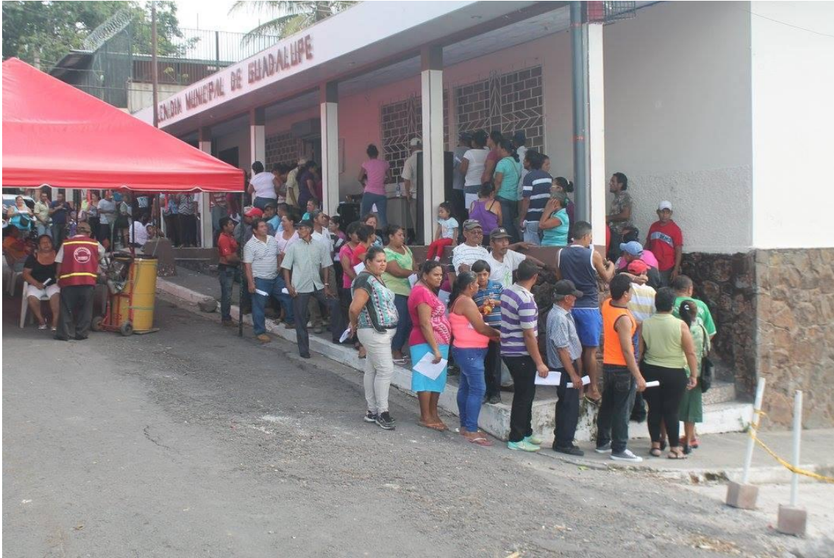
ENTREGA DE ABONO A PEQUEÑOS AGRICULTORES MONTO ASIGNADO. $19,500.00