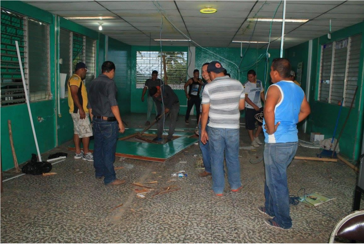
REMODELACION DE ALCALDIA MUNICIPAL $11.500.00