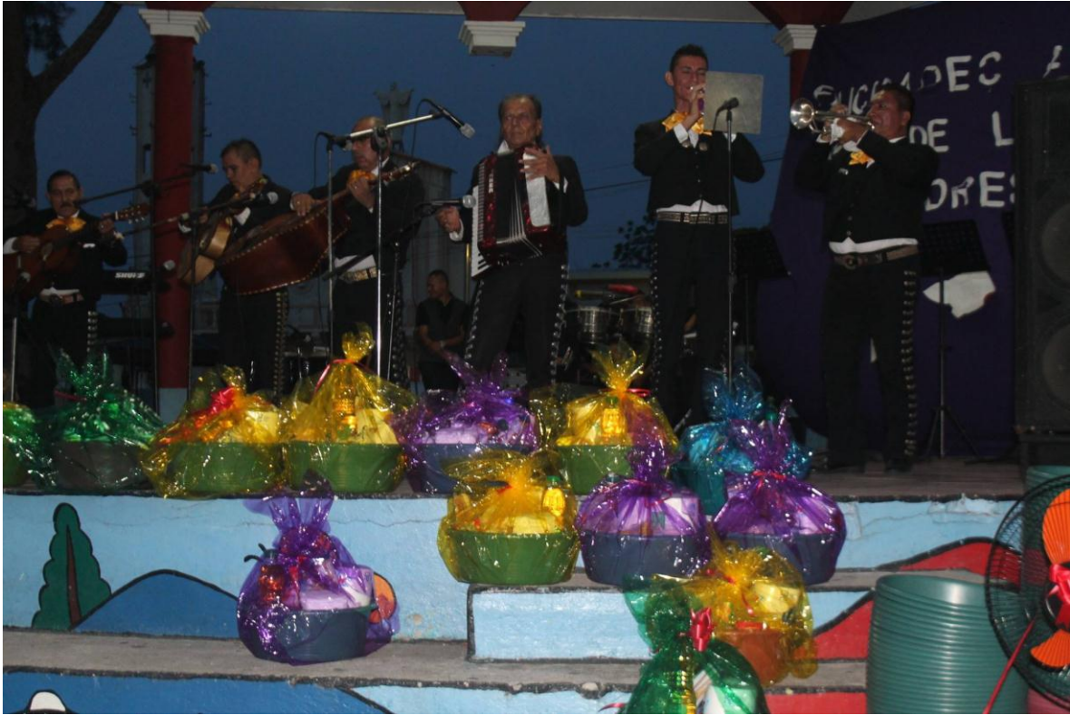
CELEBRACION DEL DIA DE LA MADRE $6,500.00