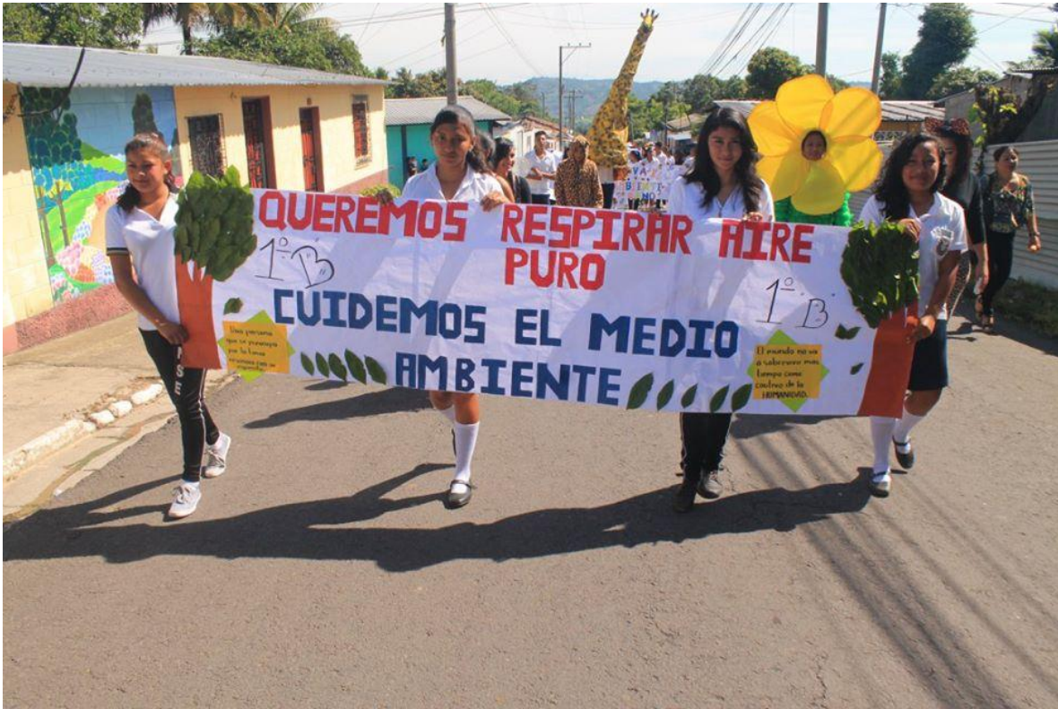
CELEBRACION DEL DIA DEL MEDIO AMBIENTE