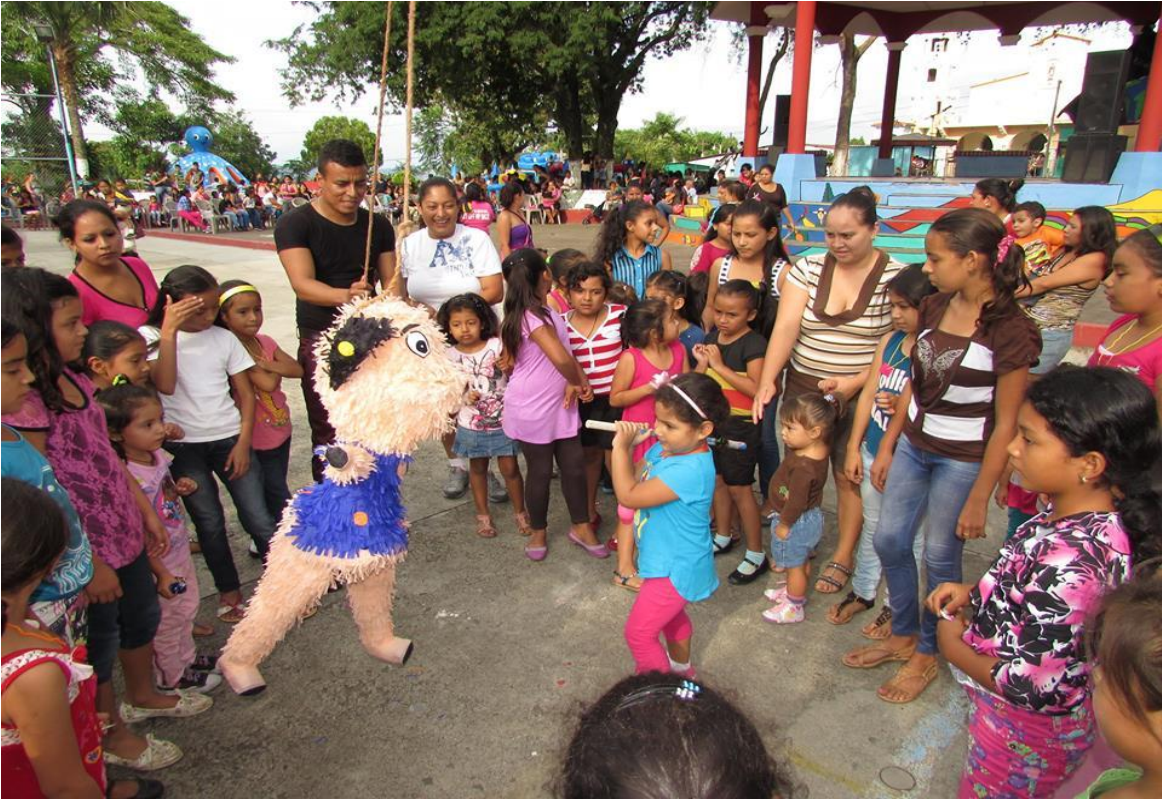
CELEBRACION DEL DIA DEL NIÑO Y LA NIÑA