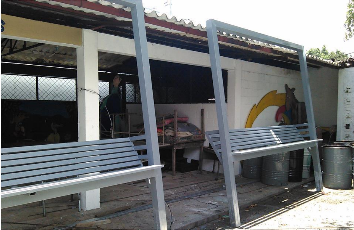
INSTALACION DE CASETAS EN LAS PARADAS DE BUSES $2,100.00