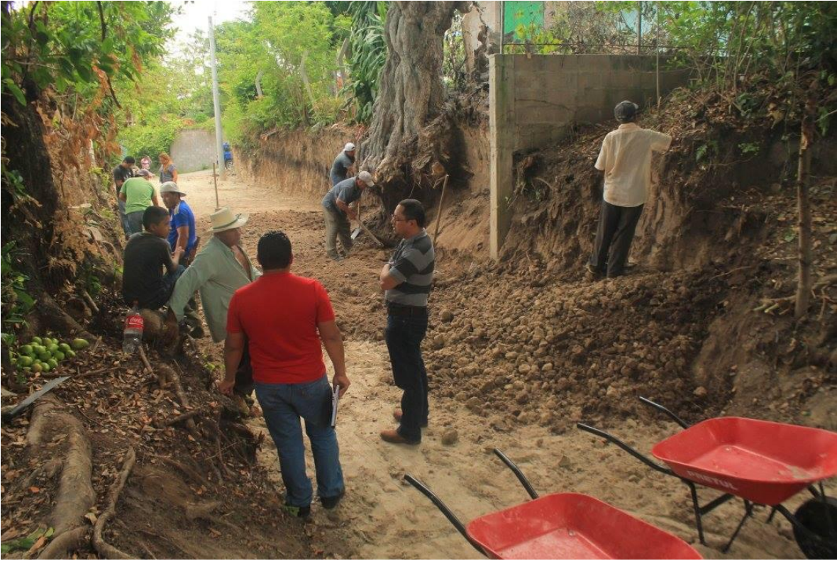
EMPEDRADO Y CONCRETADO DE CALLE EN CANTON LOS RANCHOS $10,500