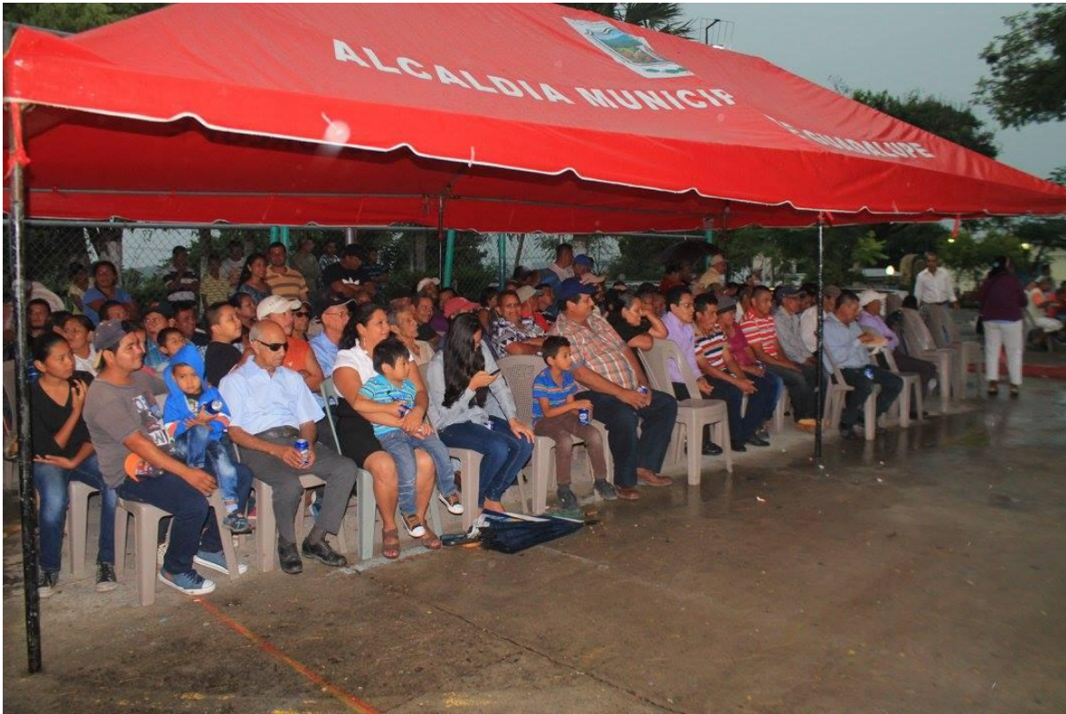
CELEBRACION DEL DIA DEL PADRE $5,000.00