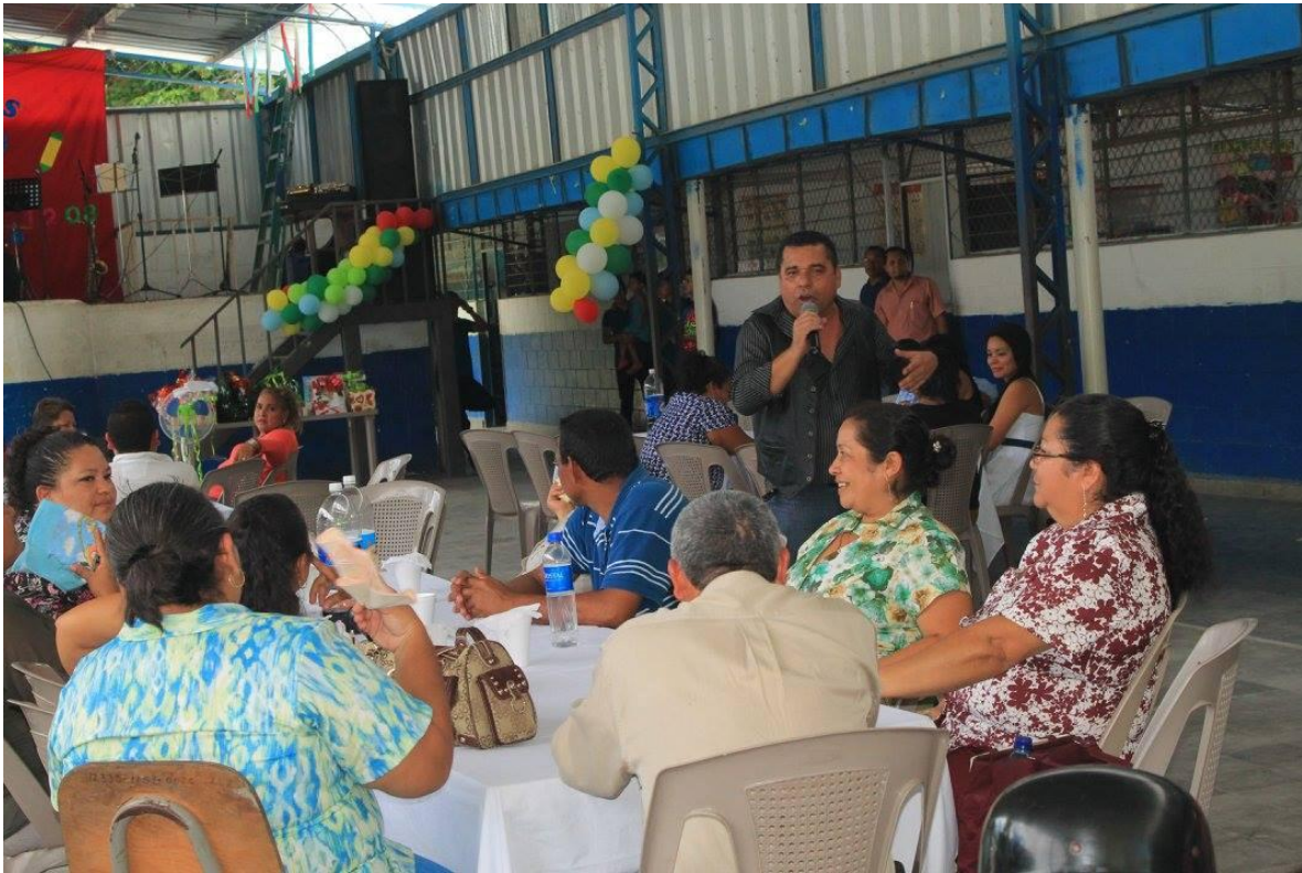
CELEBRACION DEL DIA DEL MAESTRO $1,675.00