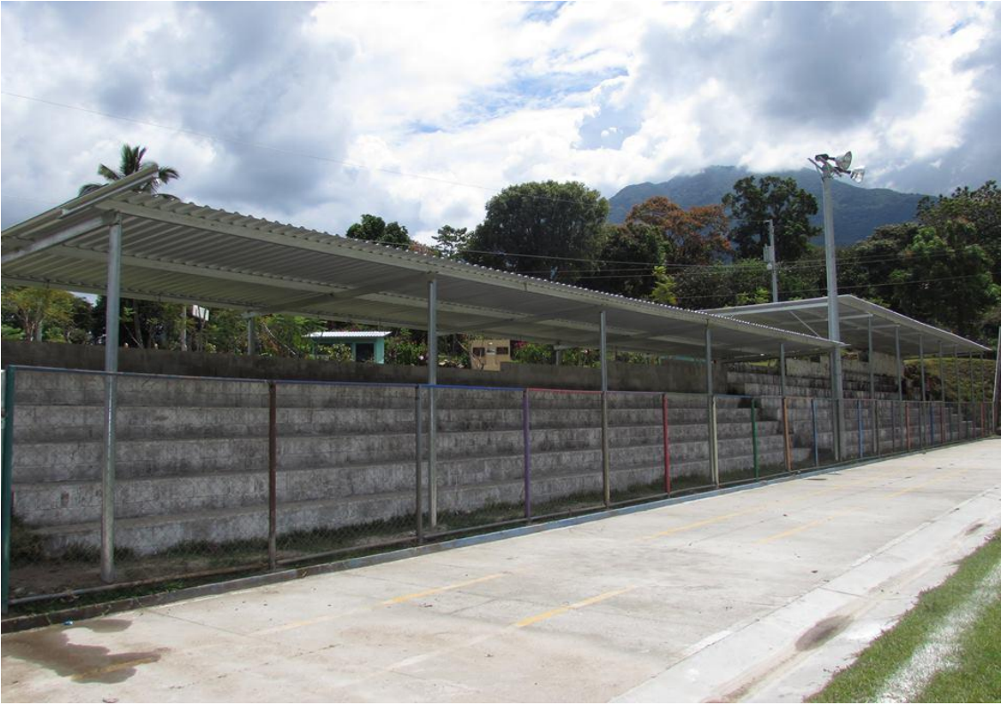
TECHADO DE POLIDERPORTIVO MUNICIPAL