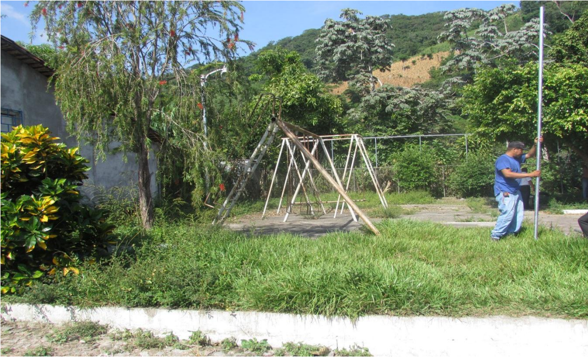
REMDELACION Y MANTENIMIENTO DE PARQUE DE LA COLONIA MODELO