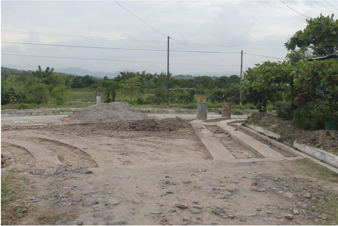
EMPEDRADO Y FRAGUADO EN COL. VISTA AL VOLCAN $3,754.00