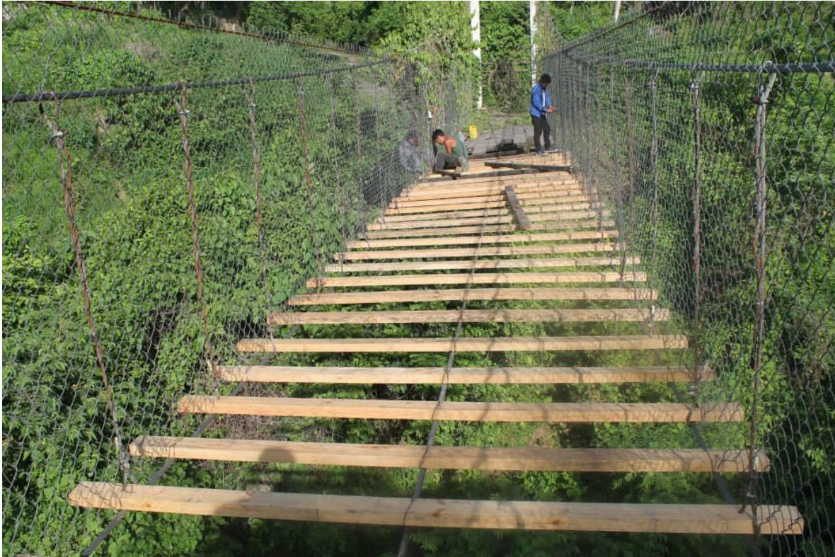
RERACION DE PUENTE COLGANTE EN AGUA AGRIA MONTOASIGNADO. $2.200.00