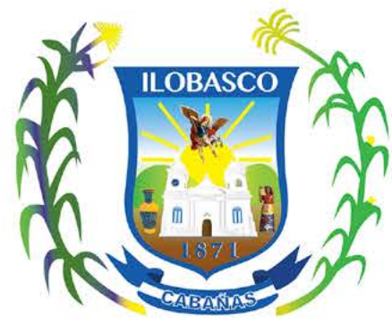
Alcaldía Municipal de Ilobasco