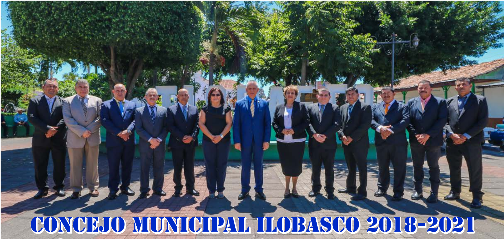
CONCEJO MUNICIPAL ILOBASCO 2018-2021

Constituye la autoridad máxima del municipio. Está integrado por un alcalde/alcaldesa, un síndico/a, regidores/as propietarios/as y suplentes elegidos para un período de tres años pudiendo ser reelectos.