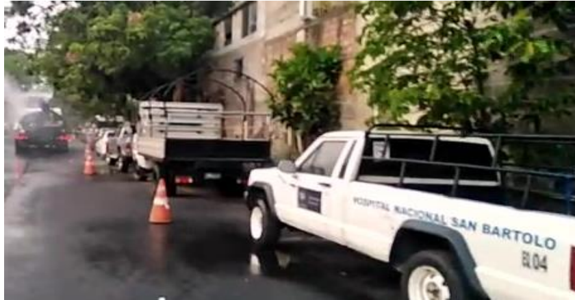
Sanitización y/o Desinfección en Avenida Meléndez cercanía de hospital de Nacional de San Bartolo, método: Riego con Pipa.