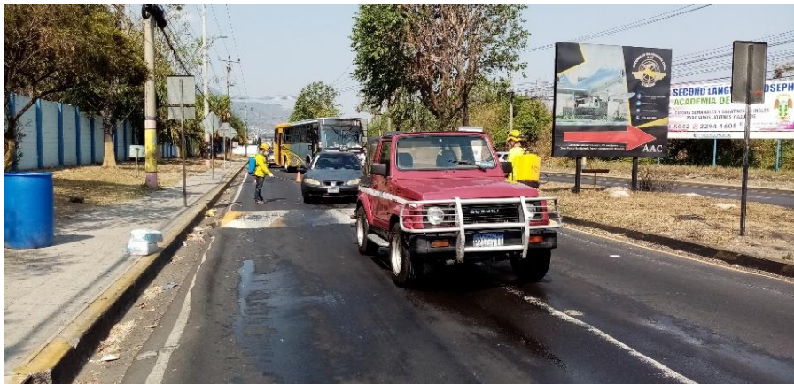
Mercado de la Colonia de La Santa Lucía Área de Lavado de manos