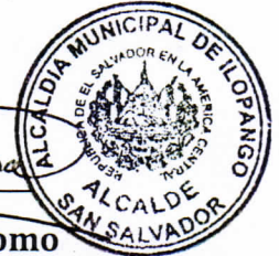
Adán de Jesús Perdomo Alcalde Municipal de Ilopango