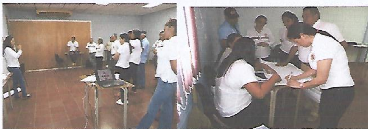
Parte de las Jefaturas en aportes para el FODA y socialización del mismo

Fuente: Construcción propia, con aportes de las jefaturas en cada mesa de trabajo, durante taller participativo para el POA. Jueves 25 de enero de 2018.