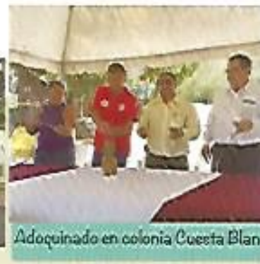
Adoquinado en colonia Cuesta Blanca