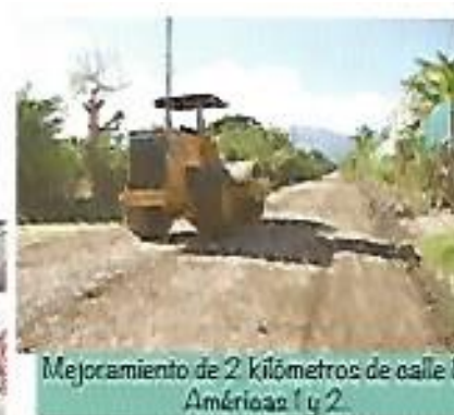
Mejoramiento de 2 kilómetros de calle Américas 1 y 2