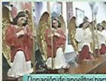
Donación de angelitos para Iglesia Católica.