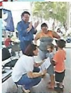
Entrega de escrituras ISTA a habitantes de Nejapa.