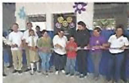
Construcción de dos aulas en Mapitapa.