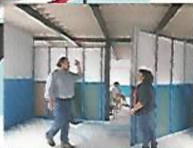
Construcción de dos aulas en San Jerónimo Los Planes.