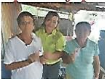
Carnetizando a nuestros adultos mayores.