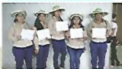
Escuela de Agricultura, Unidad de Género.