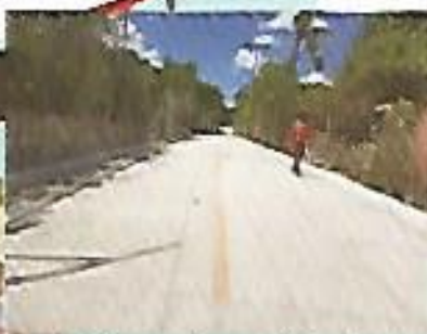
Adoquinado en calle La Granja