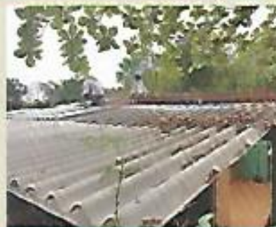
Colocación de techos en comunidad Ferrocarril.