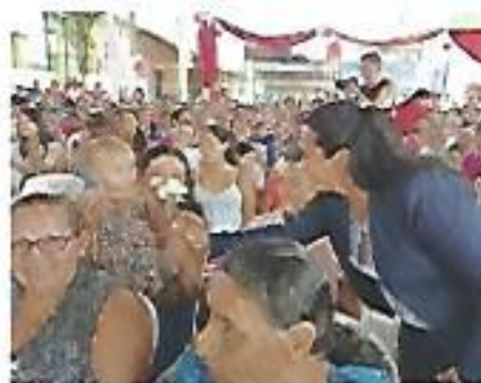
Celebración del Día de la Madre.