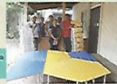
Donación de mesas y sillas para los pequeños del Círculo de Familia de Tutultepeque.