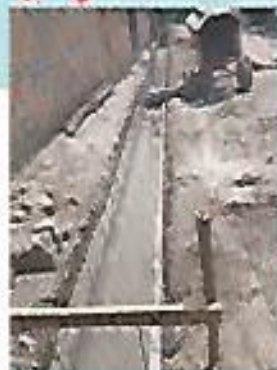
Cordón cuneta colonia El Cambio.