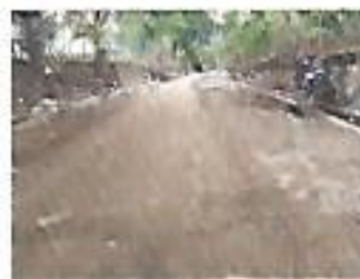
Cordón cuneta en El Castaño.