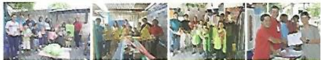
Graduación de comida mexicana y academia Microsoft.

Para el mes de Julio, Nejapa formará parte del plan El Salvador Seguro que impulsa el Gobierno de El Salvador. En nuestro municipio llevará el nombre de Plan Nejapa Seguro. En dicho plan se instalarán seis mesas de trabajo con todos los beneficios que eso conlleva. Entre ellas: seguridad territorial, rehabilitación de espacios públicos, salud, deporte y cultura, medio ambiente, educación y becas. Un elemento importante es que al trabajo que el departamento ya tiene, con la inclusión en dicho plan, se suman otras instituciones de gobierno con diferentes programas como INJUVE, INDES, ISDEMU, PREPAZ, entre otras.