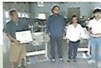
Iniciativas económicas para nuestra gente. Proyecto capita semilla COAMSS-OPAMSS