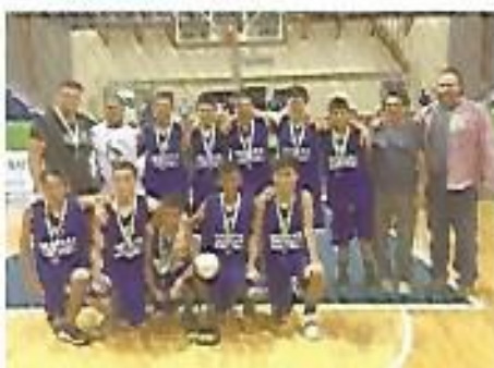
Subcampeones en basketbol a nivel nacional. Felicidades, jóvenes.