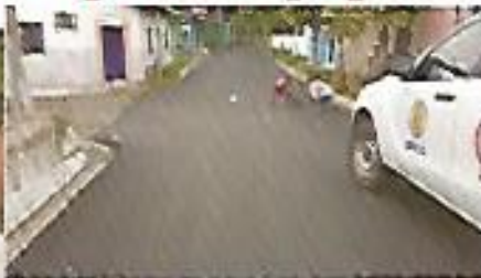
Asfaltado de 7a Calle Oriente