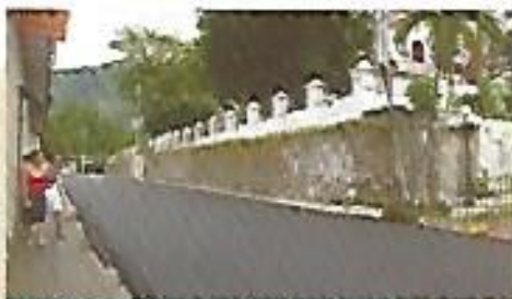
Asfaltado de Primera Calle Oriente