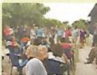
ADESCO Américas I