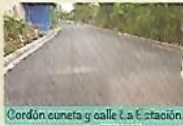
Cordón cuneta y calle La Estación