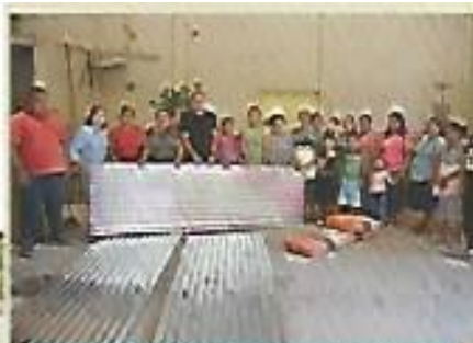
Apoyo a familias de escasos recursos económicos de Nejapa.