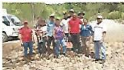
Apoyo con cemento, arena y grava para construcción de badenes en Tutultepeque.