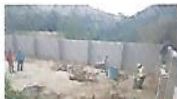
Construcción de muro en caserío El Llano.