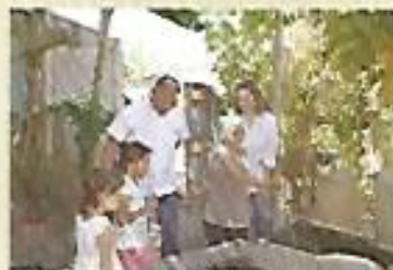
Cientos de familias beneficiadas con proyectos de agua potable en coordinación con la empresa privada.