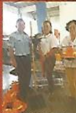
Donación de kit de herramientas para la Unidad de Gestión y Riesgo.

Esta comisión ha establecido un enlace con el MINED y se está próximo a iniciar un plan de prevención con centros escolares del municipio a raíz de la constante sismicidad del territorio Salvadoreño sin olvidar que el volcán de San Salvador recién cumplió 100 años de su última erupción y habría que estar preparado ante cualquier eventualidad.